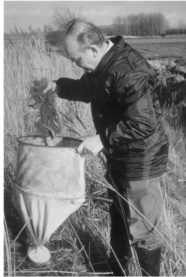
Wintergesiebe im Februar 1976 in Nideggen-Ginnik