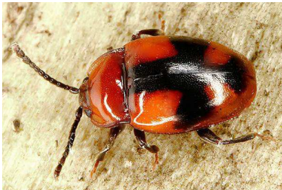
Abb. 1: Mycetina cruciata (Foto: JOSEF DVORAK @ koleopterologie.de/ gallery).

Bei dem Fundort handelt es sich um einen kleinen Teilbereich des westlichen Königsforstes, der durch die Autobahn A3, die Bensberger Straße, die Rösrather Straße und den Heumarer Mauspfad vollkommen isoliert ist. Möglicherweise ist eine gewisse Wärmebegünstigung der Fläche vorhanden. Mycetina cruciata wurde in der Roten Liste Deutschland (GEISER 1998) als gefährdet eingestuft, nimmt aber gerade in Südwestdeutschland an Fundhäufigkeit zu.