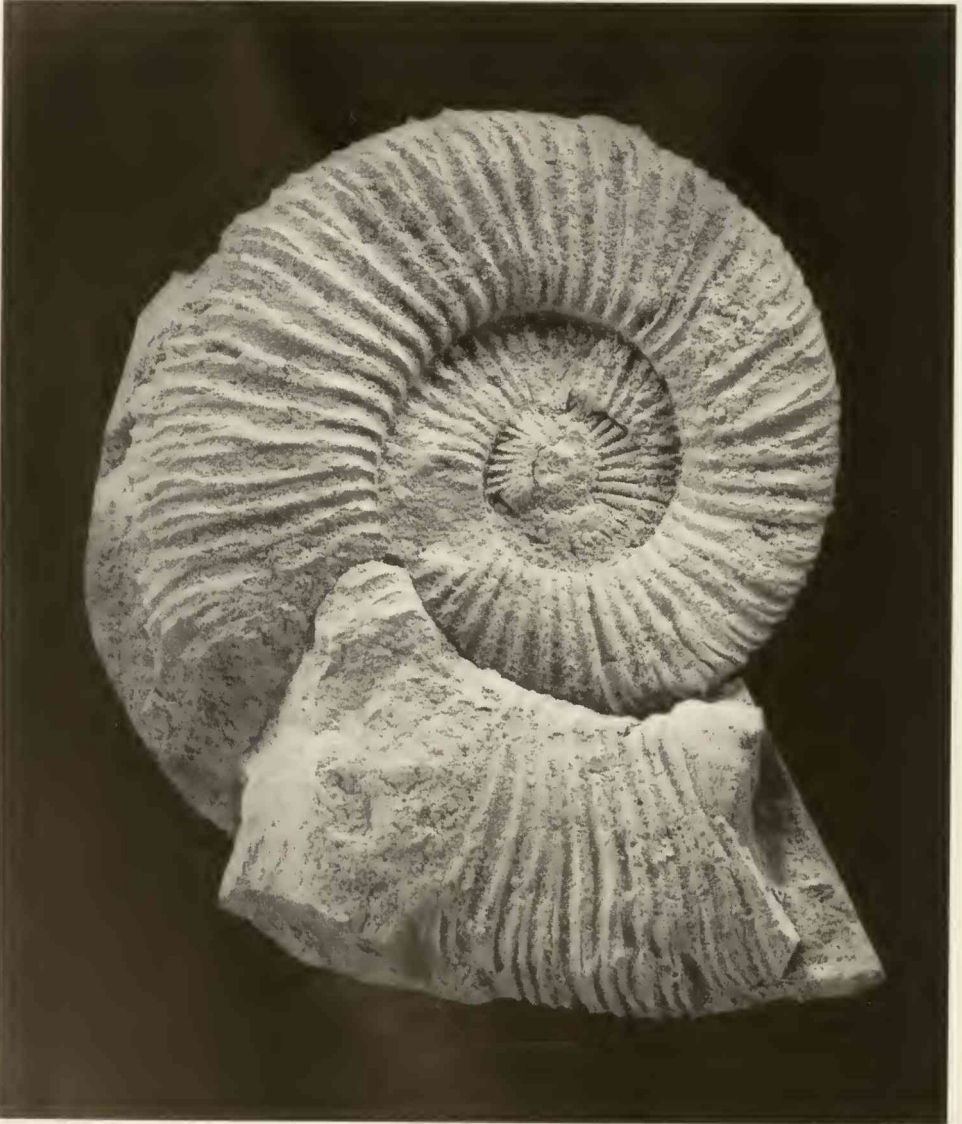
Abb. 1: Perisphinctes (Dichotomoceras) bifurcatoides ENAY, bifurcatus -Zone (mittleres Oxford), Steinbruch Winnberg b. Sengenthal. 1986 XII 16. \times 1 .

Vorkommen. Nach ENAY (1966: 513) kommt P. (D.) bifurcatoides in den „Couches d’Eiffingen“ und „Couches du Geissberg“ vor, die der bifurcatus -Zone entsprechen (ENAY, 1966: 274, Abb. 72).