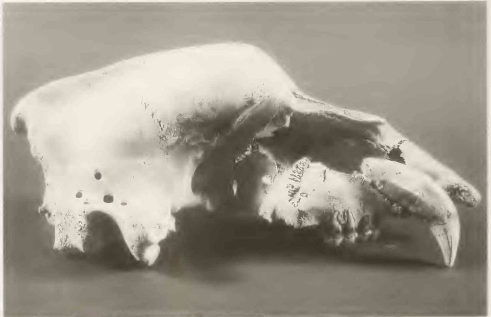
ROSENDAHL, W. & GRUPE, G.: Höhlenbären