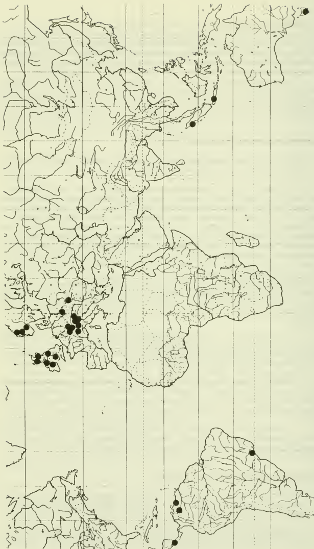
Abb. 4: Verbreitung von Trapelia mooreana