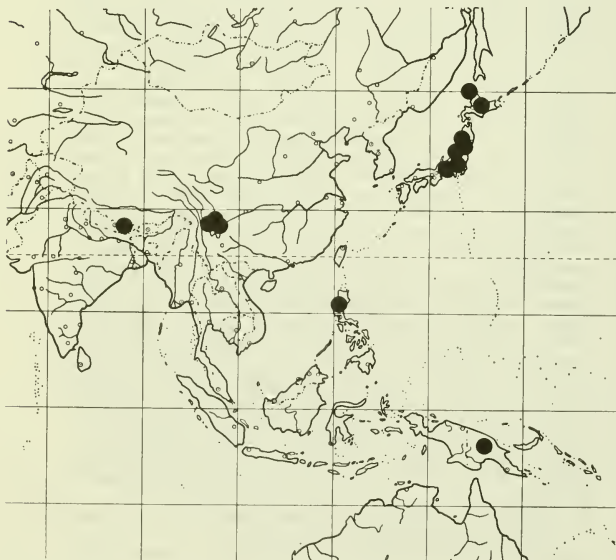
Abb.1: Verbreitung von Amygdalaria aeolotera

Die als Lecidea aeolotera aus Luzon, als Huilla alpina Zahlbr. und H. insularis Zahlbr. aus Szetschwan, als Lecidea caloplacoides Zahlbr. aus Yünnan und als Lecidea cephalophora Lamb aus Japan beschriebene Art (HERTEL 1977) wurde von HERTEL (1977) für Nepal nachgewie-