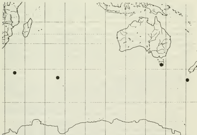
Abb.2: Verbreitung von Fuscidea asbolodes

TASMANIEN: Mt. Sprent, quartzite outcrops in Gymnoschoenus moorland, 660 m alt, locally common, 5.II.1987, leg. G.KANTVILAS no. 3/87 (M = dupl. ex herb. KANTVILAS).