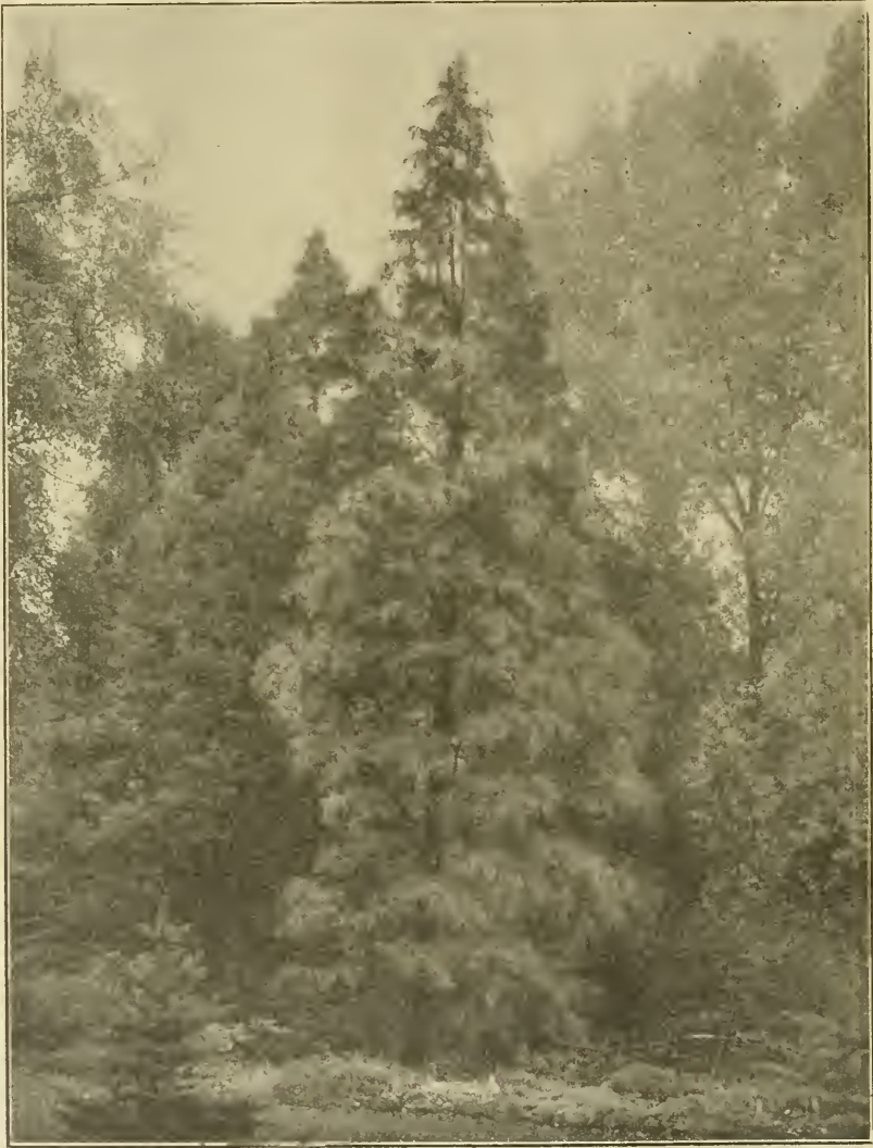
Taxodium distichum pendulum Carr.

Ich bat auch Herrn Ansorge Kl. Flottbek um Material von Prachtexemplaren, welche noch aus den alten Beständen der ehemaligen Booth'schen Baumschulen