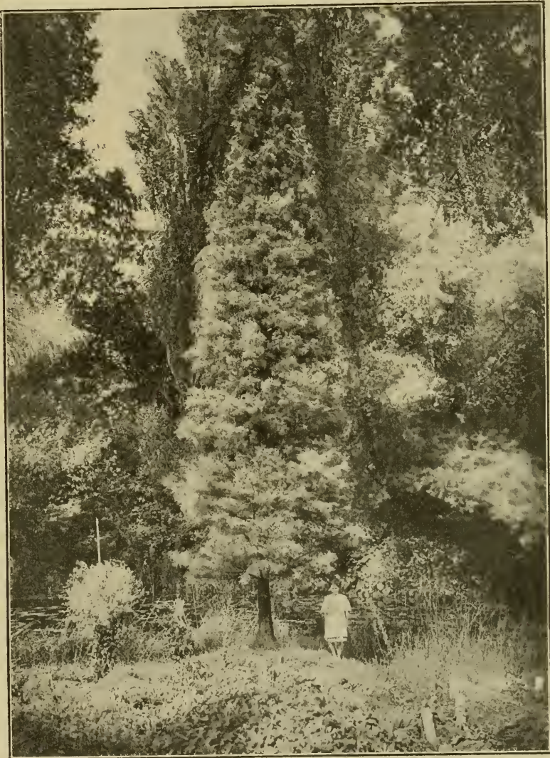
Taxodium distichum erectifrons.

Zwei Prachtexemplare dieser beiden Formen stehen z. B. im botanischen Garten in Straßburg i. E. am Teich, die ich früher auch sah und auf welche mich Herr Garteninspektor Schelle -Tübingen, der sie kürzlich sah, besonders aufmerksam