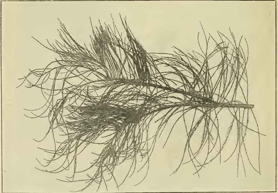
Taxodium distichum erectifrons Schelle.