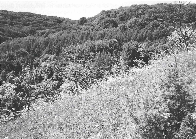
Abb. 1: Das Z. fausta -Habitat.

Das fausta -Habitat wird vom Geranio-Peucedanetum cervariae geprägt, in dem Coronilla coronata (an Optimalstandorten dicht gedrängt wachsend) und Scabiosa columbaria reich vertreten sind. Aster amellus tritt optisch vor der Blüte nicht in Erscheinung. Die hohen Halme von Bromus erectus setzen deutliche Akzente, seine Rispen sind für Z. fausta die bevorzugten Ruhe- und Schlafplätze. Locker über den Hang verstreut finden sich Anthericum ramosum , Bupleurum falcatum , Carlina vulgaris und Centaurea scabiosa . Origanum vulgare ist im oberen Hangdrittel nur lokal in Waldrandnähe, teils halbschattig stehend, häufig. Reste anthropogener Prägung sind Birn- und Apfelbäume, im oberen Hangbereich überwiegend abgestorben, sowie alte Querwege, hangseitig von Trockenmauerfragmenten begrenzt.