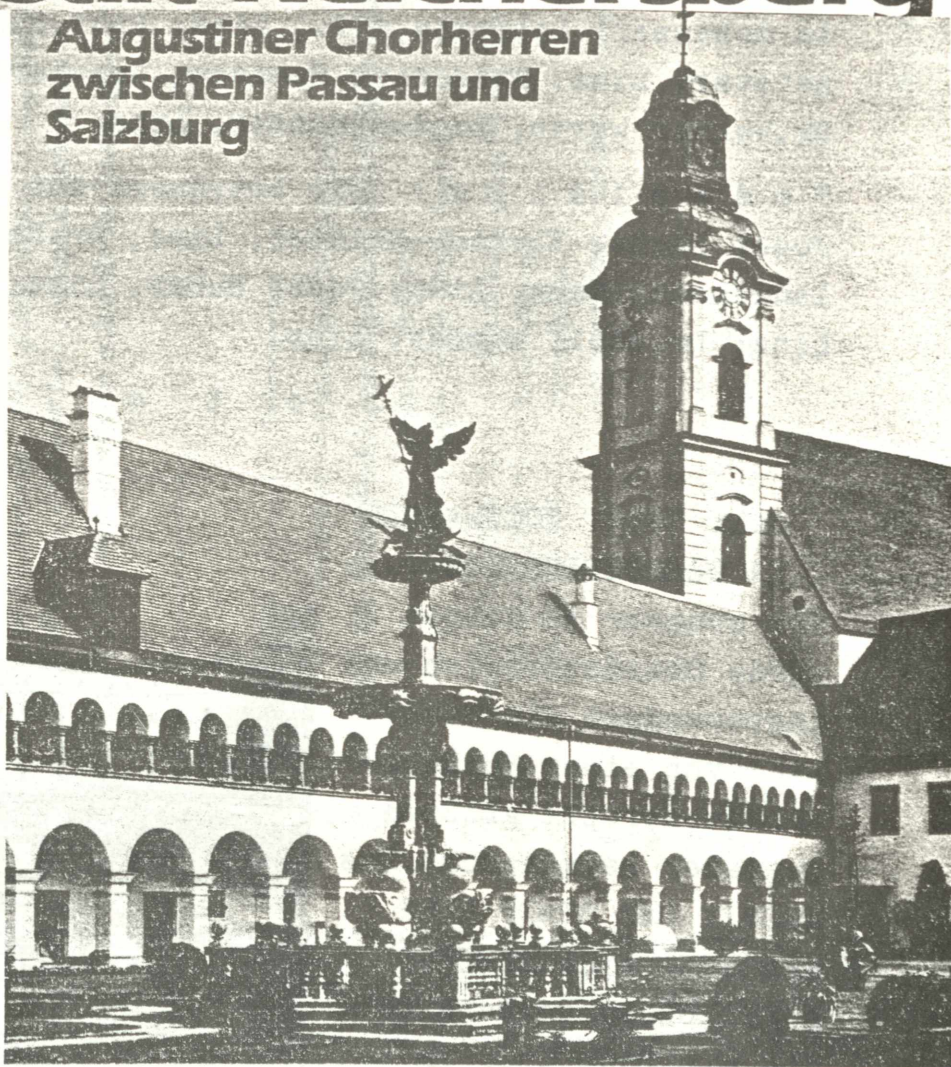
AUGUSTINER-Chorherrenstift Reichersberg, äußerer Stiftshof mit Michaelsbrunnen, Thomas Schwanthaler.

Ranshofen, das Domstift zu Salzburg und natürlich das jubelnde Kloster Reichersberg selbst in den Prunkräumen des Stiftes vorgestellt.