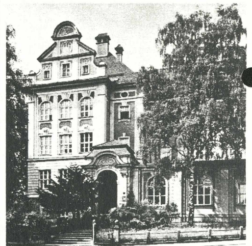
Römerbergschule, Linz, erbaut 1907 von Mathäus Schlager

In allen historischen Disziplinen begegnet man dem Phänomen der Verkürzung des Zeitab-