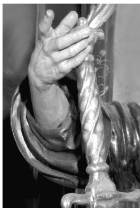
Hl. Paulus, Pfarrkirche Mattighofen, Detail

Dieser arbeitete bis zu seinem Tod in Venedig, wo er für die deutschen Bildhauer eine ähnliche Bedeutung erlangte wie Carl Loth (Carlotto) für die Maler.