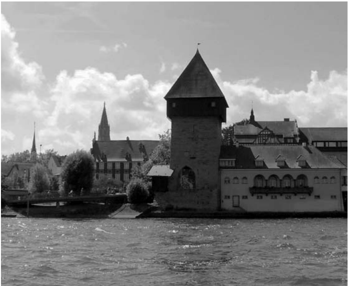
Konstanz, Rheintorturm

Vor 600 Jahren, 1414 bis 1418, sind über 70.000 Menschen zum Konzil von Konstanz an den Bodensee gekommen. In der Kirchenversammlung sollte die Spaltung der Kirche überwunden und ihre Erneuerung „an Haupt und Gliedern“ in Gang gesetzt werden. Die Lehren von John Wycliff und Jan Hus wurden als Ketzertum verurteilt, letzterer in Konstanz trotz Zusicherung des kaiserlichen Geleites verbrannt. In diesen Jahren war die Stadt auch Zentrum der europäischen Politik und Begegnungsstätte der europäischen Kulturen. Herausragende Exponate, aus ganz Europa zur Verfügung gestellt, werden in einer großen Ausstellung des Landes Baden-Württemberg am Original-