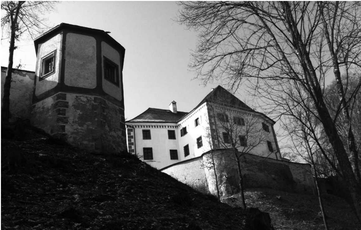
Schloss Schlüßberg heute

Mitte des 12. Jahrhunderts taucht Schlüßberg in Urkunden auf, im Besitz der Schlüßberger, die im 14. Jahrhundert in den Ritterstand des Landes Oberösterreich aufsteigen. In der Folge finden sich in der Besitzerliste die Schifer, Jörger, Hohenfelder sowie die Siegmar von Schlüßberg. Wie so viele Familien musste die Familie Siegmar im Zuge der Gegenreformation das Land verlassen.