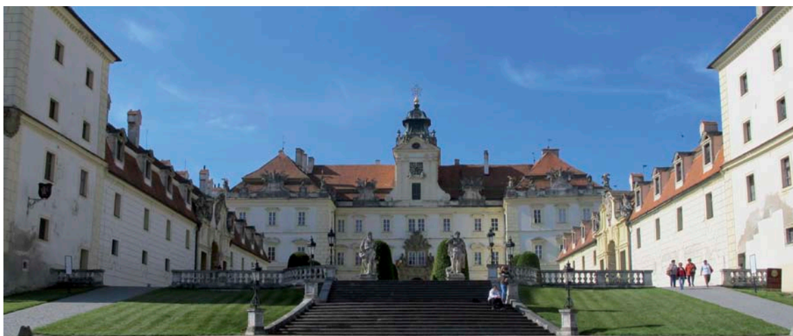
Schloss Valtice (Foto: Huhulenik, Wikimedia Commons).