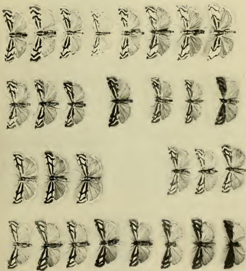
a b c d e f g h