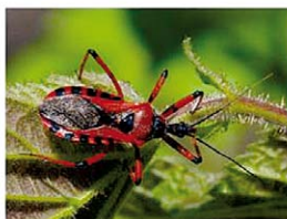
Organismen gibt es in einer unglaublichen Typenfülle sowie in allen erdenklichen Abmessungen. Mordwanz