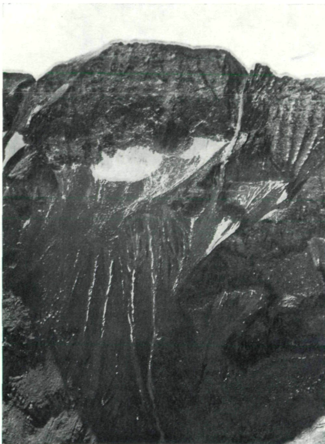
Abb. 1: NE-Wand der Hohen Leier 2774 m.