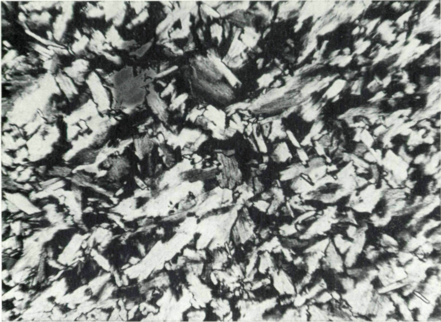
Abb. 1: Graugrüner Antigoritit aus der würmeiszeitlichen Terrasse von Frohnleiten. Dieses Gestein ist auf einen Peridotit zurückzuführen, in dem Olivin herrschend war. Bei der Metamorphose wurde der Olivin vollständig in Blätterserpentin umgewandelt. Im obigen Dünnschliff-Bildausschnitt sieht man die Anordnung der Antigorite (Individuen bis 0,21 mm lang) in mehreren Scharen, aber nicht die typische Gitterstruktur, wie solche als Muster des öfteren in Abbildungen dargestellt wird. Herkunft dieses Antigoritites aus der Umgebung von Leoben, Donawitz oder Trofaiach (Grauwackenzone). Ein Zeugnis für einen Maschenserpentin von Kraubath liegt nicht vor. — Durchlicht. Nic. +