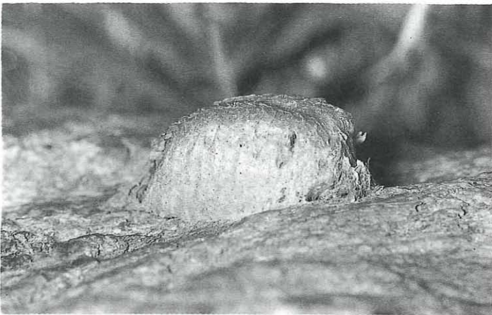
Abb. 2: Eigelege von Mantis religiosa (natürliche Länge: 26 mm); junge Larven bereits ausgeschlüpft.

Wildon, an der Schulmauer, 1987, 1 Ex., CAROL VEENSTRA, Graz, beob.