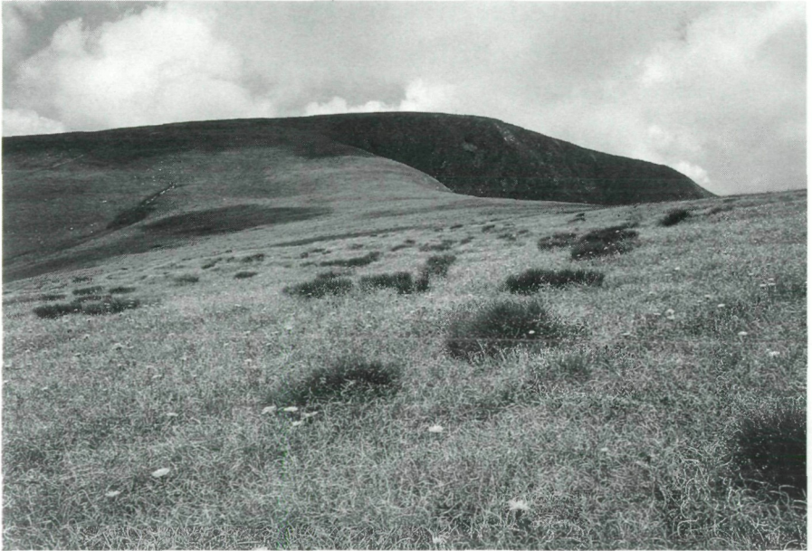
Abb. 1: Untersuchungsfläche „Ringkogel“.

Die Untersuchung wurde im Gebirgsmassiv des Großen Ringkogels (2277 m) und des Pletzen (2345 m) durchgeführt, das dem Hauptzug der Seckauer Alpen, welchen es zugerechnet wird, südwestlich vorgelagert ist. Die Untersuchungsfläche „Ringkogel“