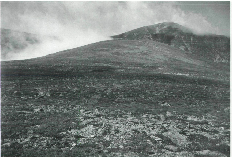
Abb. 2: Untersuchungsfläche „Hirschfeld“.