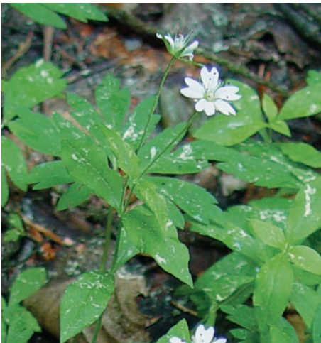
Abb. 6: Pseudostellaria europaea in Blüte. Flowering Pseudostellaria europaea.