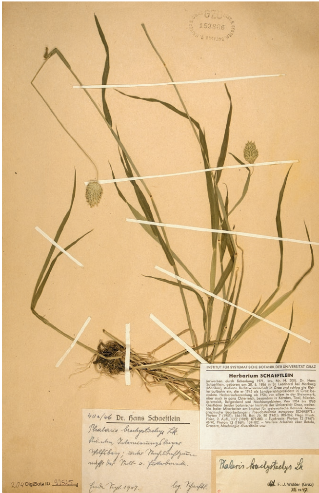
Abb. 2: Herbarbeleg von Phalaris brachystachys , gesammelt von Hans Schaefflein Ende September 1946 im Internierungslager Wolfsberg unter Stacheldrahtzaun nächst der Stall- und Futterbaracke. (Herbarium GZU).

Herbarium specimen of Phalaris brachystachys , collected by Hans Schaefflein at the end of September 1946 in the internment camp Wolfsberg under a barbed wire fence near barn and feed barrack. (Herbarium GZU).