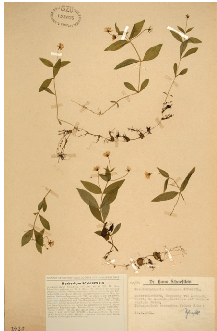
Abb. 7: Herbarbeleg von Pseudostellaria europaea , gesammelt von Hans Schaeftlein am 14. April 1961. Die Wurzelknollen sind entlang eines Rhizoms aufgereiht. (Herbarium GZU). Herbarium specimen of Pseudostellaria europaea , collected by Hans Schaeftlein on April 14 th , 1961. Root bulbils are conspicuous along a rhizome. (Herbarium GZU).