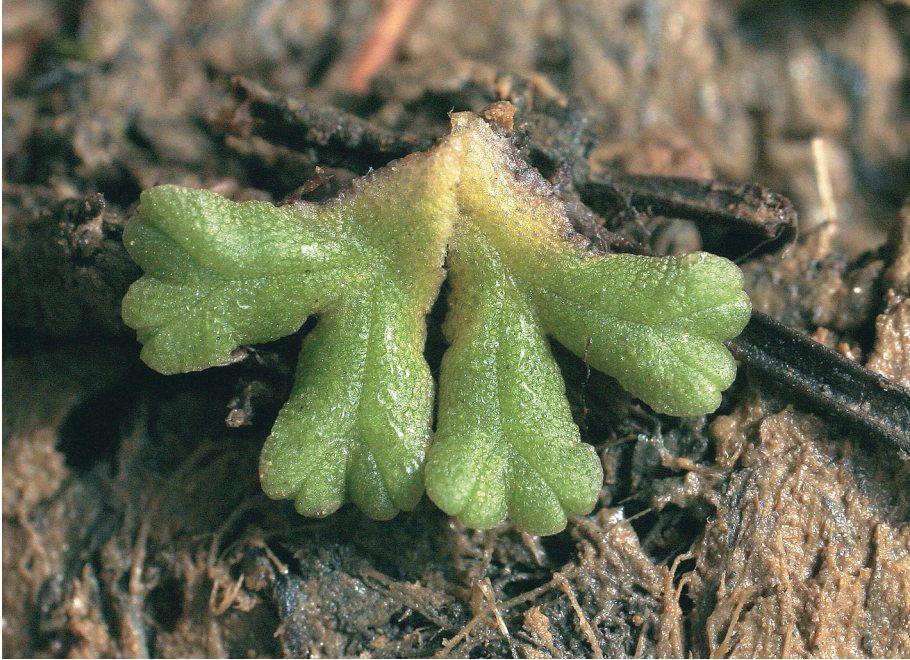
Abb. 3: Landform von Ricciocarpus natans am Großen Neudauer Teich, 20. 10. 2009, Terrestrial plants of Ricciocarpus natans on mud at Großer Neudauer Teich, 20. 10. 2009