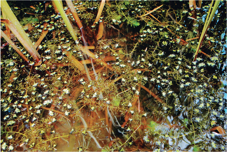
Abb. 6: Das Riccietum fluitantis am Großen Neudauer Teich, 7. 7. 2011, The Riccietum fluitantis community at the Großen Neudauer Teich, 7. 7. 2011