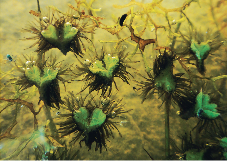
Abb. 1: Ricciocarpus natans, schwimmend im Großen Neudauer Teich, 7. 7. 2011, Ricciocarpus natans, aquatic plant swimming on water surface at Großer Neudauer Teich, 7. 7. 2011