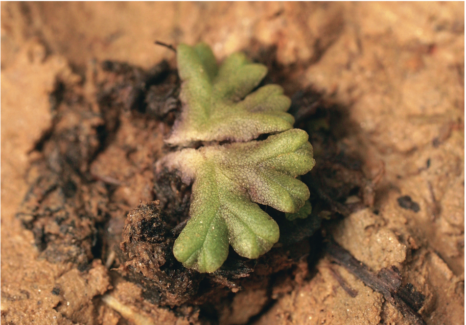
Abb. 2: Landform von Ricciocarpus natans am Großen Neudauer Teich, 20. 10. 2009, Terrestrial plants of Ricciocarpus natans on mud at Großer Neudauer Teich, 20. 10. 2009