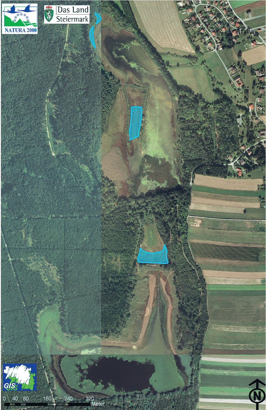
Abb. 5: Verbreitung von Ricciocarpus natans (blau schraffiert) im Gebiet der Neudauer Teiche (Steiermark). Ricciocarpus natans (blue hatched) at Neudauer Teiche area (Styria).