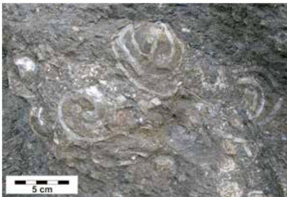
Abb. 4: „Actaeonellen“ in den Konglomeraten an der Straße Galmansegg Richtung Geistthal (siehe Text).