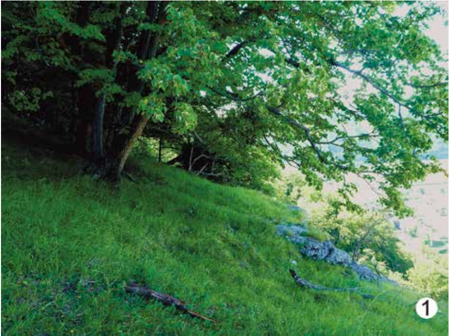
Abb. 1: Trockenrasen auf Felsvorsprung im Bereich der Peggauer Wand. Fig. 1: Peggau, west exposed dry meadow on a ledge near the top of the cliff.