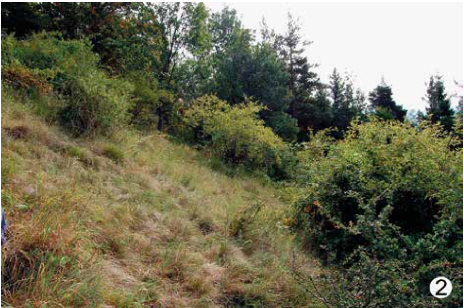
Abb. 2: Trockenrasen am Zigöllerkogel. Fig. 2: Dry meadow on the south-east slope of Zigöllerkogel.