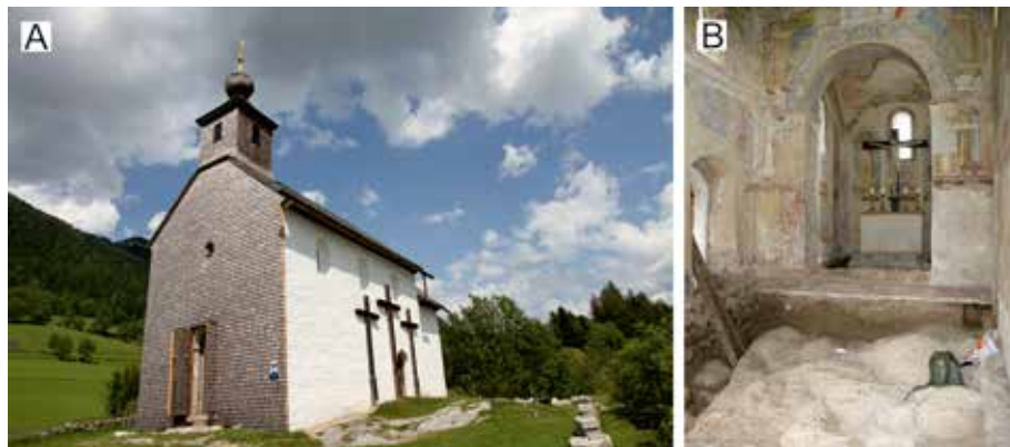
Abb. 1: Johanneskapelle in Pürgg. (A) Neben dem romanischen Bauwerk ist der Felsuntergrund aus Dachsteinkalk der Verwitterung ausgesetzt. Ursprünglich vorhandene Gletscherpolitur und -schrammen sind hier deshalb nicht erhalten geblieben. (B) Freigelegter Dachsteinkalk-Untergrund im Ostteil des Langhauses mit Resten der schützenden Geschiebemergelüberdeckung.