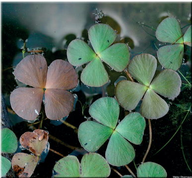
Abb. 3: Schwimmblätter des Kleefarns, Neuteich (Wundschuh)