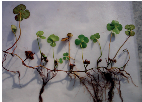
Abb. 4: Landblätter mit Sporokarprien, Neuteich (Wundschuh, 2011 07 31)