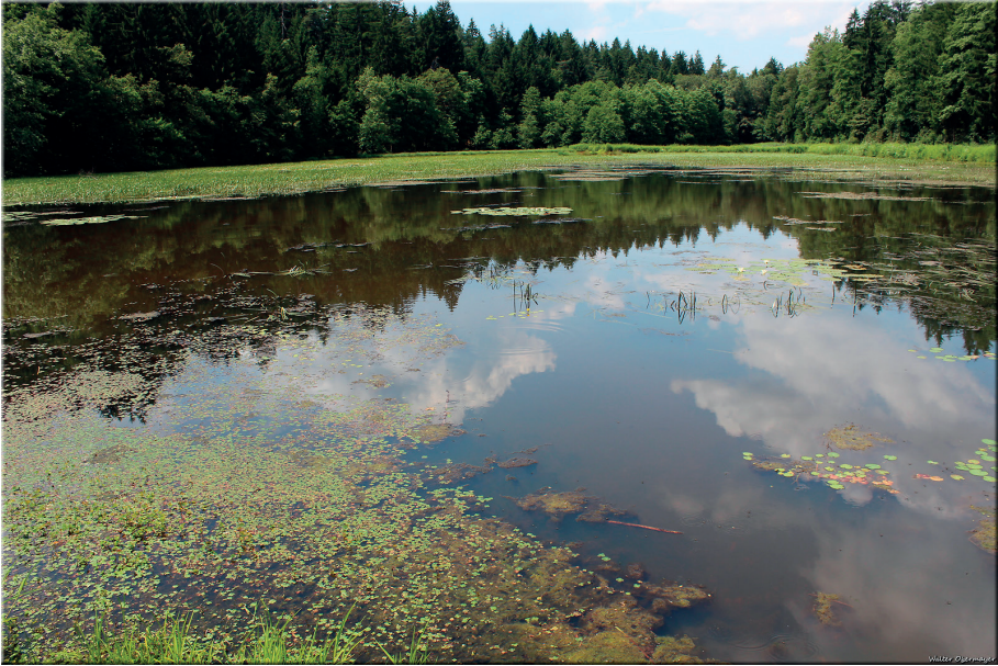
Abb. 2: Bestand von Marsilea quadrifolia am Neuteich (Wundschuh,)