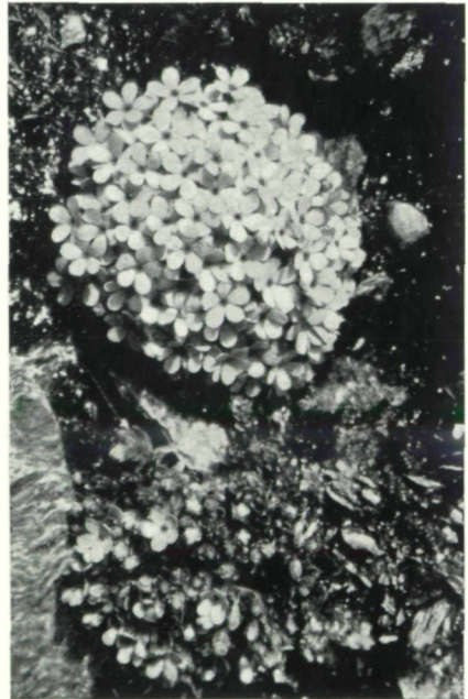
Abb. 5: Androsace alpina (L.) LAM.