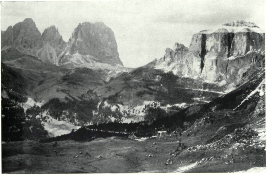
Abb. 1: Dolomiten