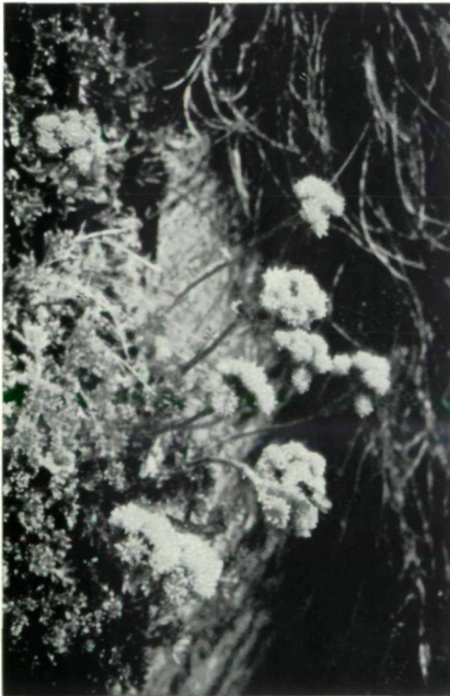
Abb. 4: Artemisia glacialis L.