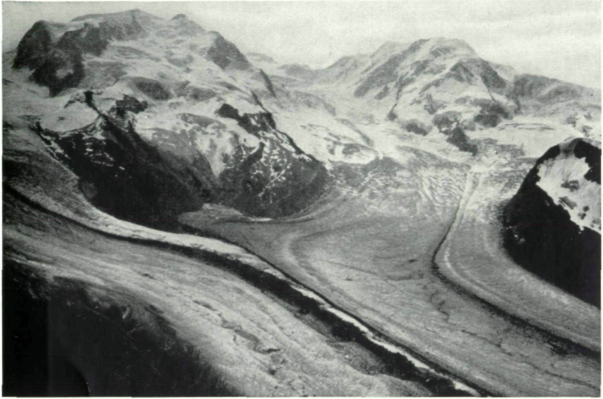
Abb. 3: Blick vom Gornergrat; Gornergletscher