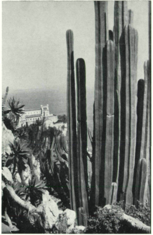
Abb. 8: Echinocactus grusonii , phot. L. Wiesmayr.