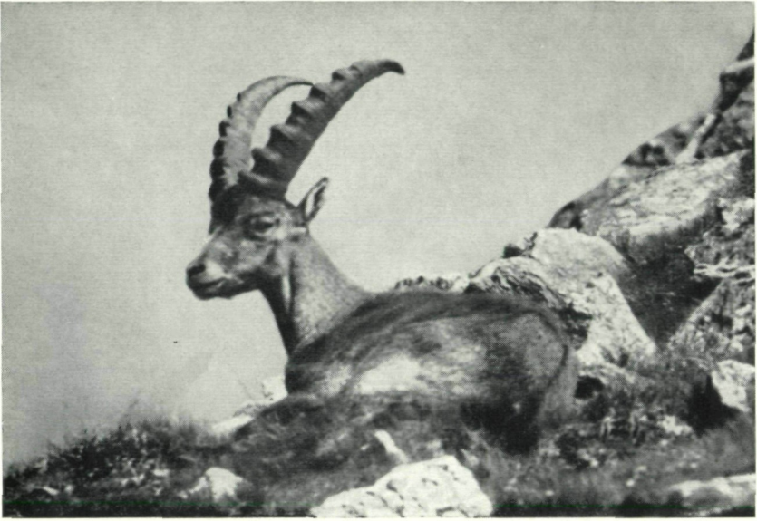
Abb. 1: Steinbock im Gebiet des Lauzon, Nationalpark Gran Paradiso, phot. L. Wiesmayr.