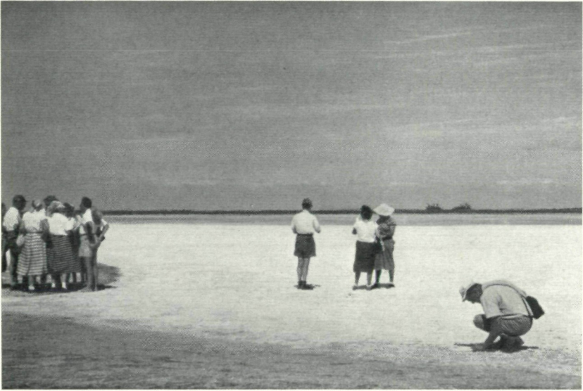
Abb. 5: Camargue, ausgetrockneter Salzsee,