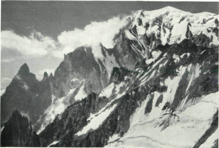
Abb. 4: Peuteretgrat mit Mt. Blanc (4810 m),