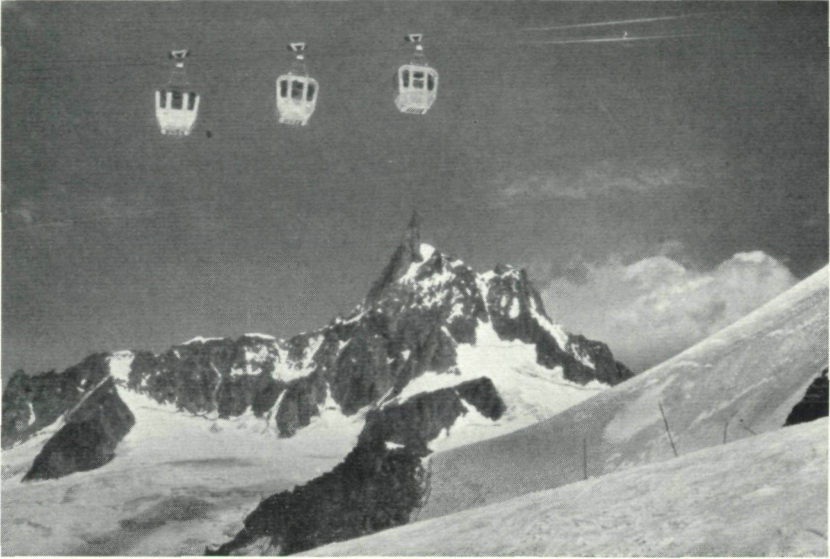
Abb. 3: Fahrt zur Aiguille du Midi (3842 m) mit Blick auf den Dent du Géant.