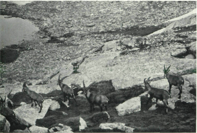
Abb. 2: Steinböcke in ihrem Biotop am Lauzon, Nationalpark Gran Paradiso, phot. K. Kalcher.