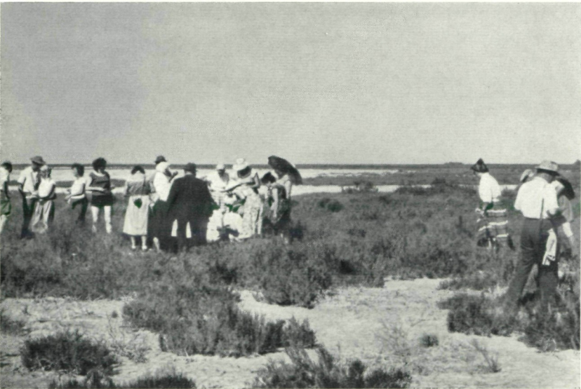
Abb. 6: Camargue, Salzsteppe, Association mit Arthrocnemum glaucum ,