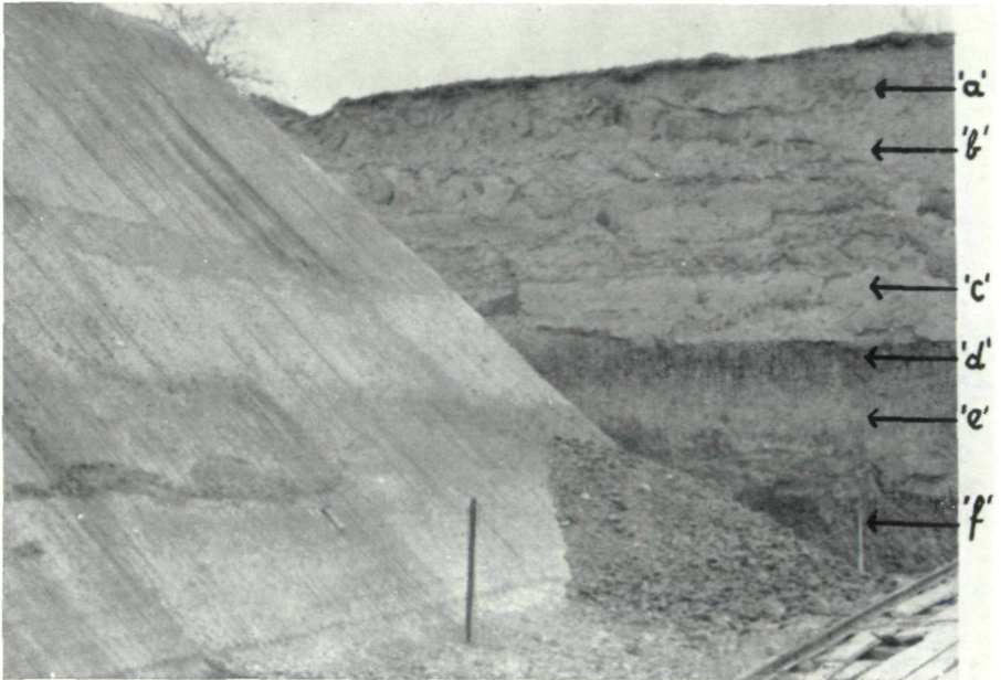
Taf. II: Ostwand der Ziegeleigrube der Fa. HAUGENEDER in Messendorf bei Graz, Verhältnisse im Herbst 1961. Die einzelnen Horizonte, aus denen die Proben 'a' bis 'f' entnommen wurden, sind mit Pfeilen bezeichnet.