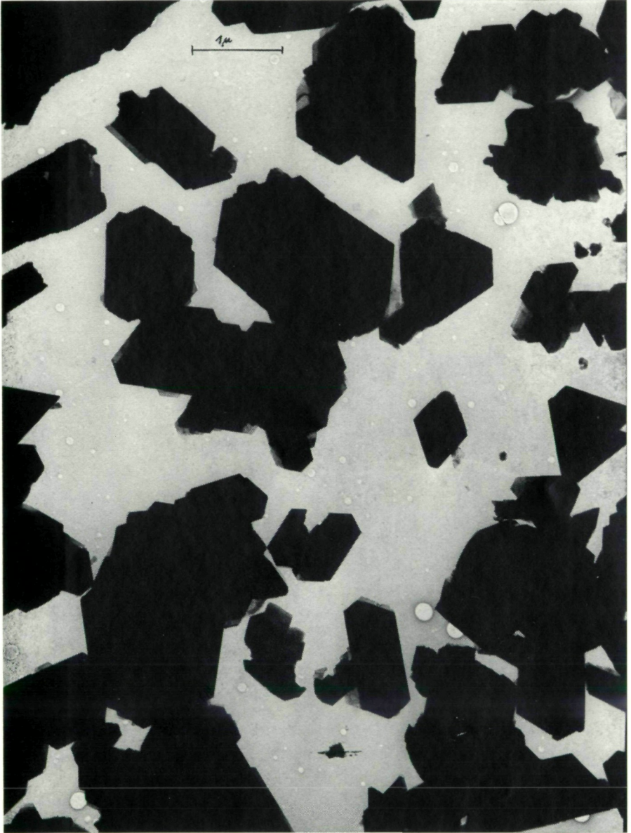
Abb. 1: Elektronenoptische Aufnahme des Kluftmaterials aus dem Steinbruch Schloßberg bei Leutschach. 24.000 ×