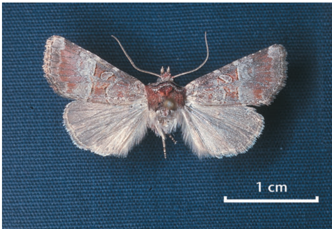
Abb. 1: Erster hessischer Nachweis von Mesoligia literosa , jetzt in der Hessensammlung Schmetterlinge im Senckenberg-Museum, gespannter Falter.

Um das Artenspektrum und die Populationsdynamik der Nachtfalterfauna in meinem Heimatort Villmar-Weyer zu dokumentieren, betreibe ich seit vielen Jahren regelmäßig in meinem Hausgarten Lichtfang mit einer 40-W-Schwarzlichtlampe (Leuchtstoffröhre). Die meisten anfliegenden Arten sind mittlerweile zu alten Bekannten geworden und können somit an Ort und Stelle bestimmt werden, ohne daß die Tiere abgetötet werden müssen. Am 24. VII. 1992 saß eine kleine Eule an der von UV-Licht angestrahlten Hauswand, die mir durch die eigenartige Fluoreszenz der Vorderflügel auffiel. Der Falter wurde aufgesammelt und präpariert. Mit dem Zettel „ literosa? “ versehen, wurde er später in meiner Lokalsammlung eingereiht – und vergessen.