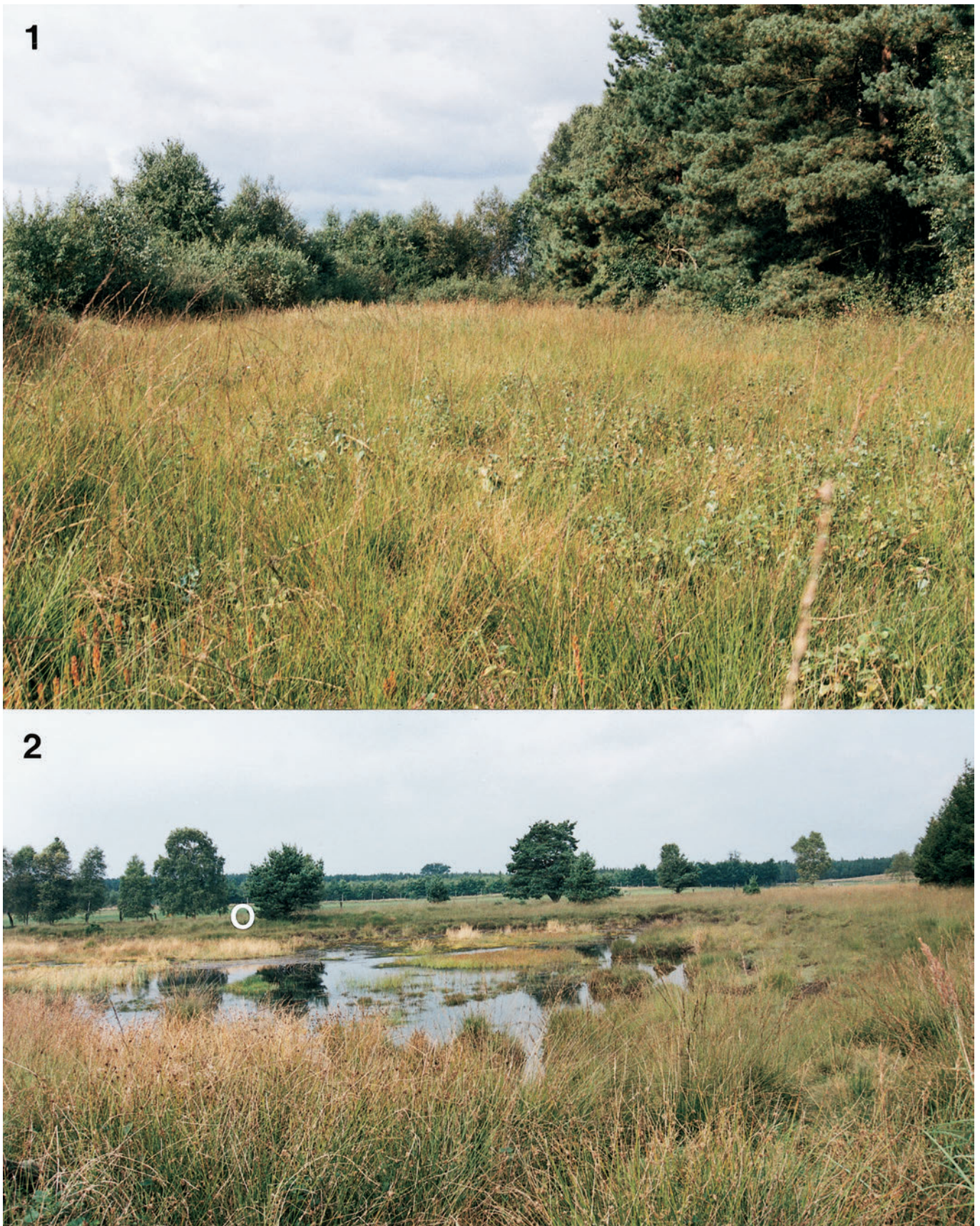
Abb. 1: Langjähriger Flugort von Glaucopsyche (Maculinea) alcon auf einer zunehmend verbuschten Moorwiese. Abb. 2: Ansiedlungsplatz von G. alcon . Der Standort der mit Eiern im Jahre 1997 vom ursprünglichen Flugort (Abb. 1) belegten Pflanze des Lungenezians ist mit einem weißen Kreis bezeichnet.

Nach derzeitigem Kenntnisstand gibt es G. alcon in Westeuropa hinsichtlich seiner Wirtsameisen in (mindestens) drei geografisch getrennten Rassen (Spanien, wohl auch Frankreich bei M. scabrinodis ; Niederlande bei M.