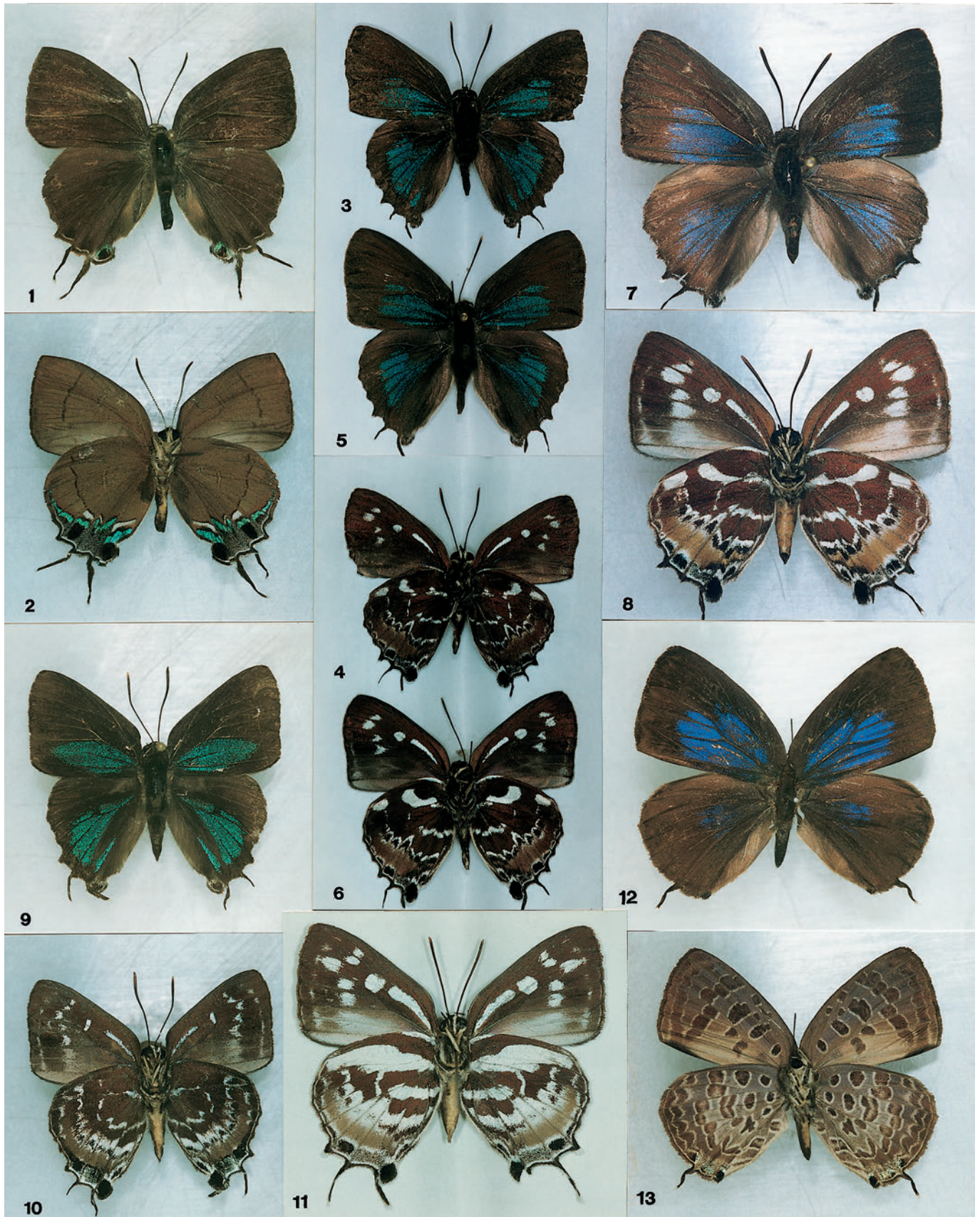
Farbtafel, Abb. 1–2: Remelana esra callias n. ssp. Abb. 1: Holotypus ♂, Mapun Is. Abb. 2: Ventralseite. Abb. 3–11: Falter der Gattung Iraota . Abb. 3: I. alticola n. sp., Paratypus ♂, Mt. Halcon, N. Mindoro. Abb. 4: Ventralseite. Abb. 5: I. alticola n. sp., Paratypus ♂, Mt. Halcon, N. Mindoro. Abb. 6: Ventralseite. Abb. 7: I. alticola n. sp., Paratypus ♀, Mt. Halcon, N. Mindoro. Abb. 8: Ventralseite. Abb. 9: I. rochana zwickorum n. ssp., Holotypus ♂, Mapun Is. Abb. 10: Ventralseite. Abb. 11: I. rochana austrosuluensis SCHROEDER & TREADAWAY, ♀, Ventralseite, Bongao Is. Abb. 12: Arhopala alitaeus masarana SCHROEDER & TREADAWAY, ♀, Babuyan Is. Abb. 13: Ventralseite.