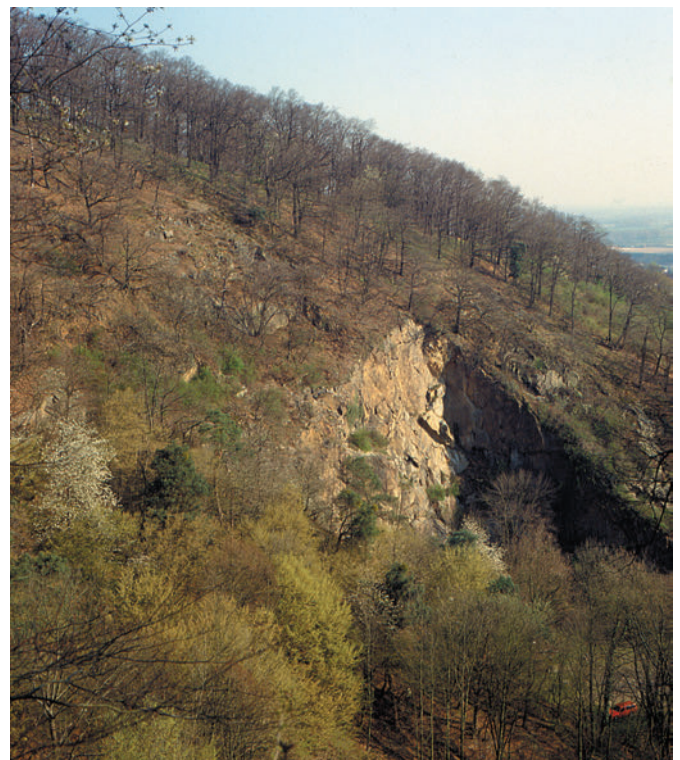
Abb. 1: Biotopaufnahme aus dem NSG „Orbishöhe von Auerbach und Zwingenberg“, III. 2002. Eichenbuschwald, Felskuppe.

Das NSG ist Teil des ca. 930 ha großen Flora-Fauna-Habitat-Gebietes „Kniebrecht, Melibocus und Orbishöhe von Seeheim-Jugenheim, Alsbach und Zwingenberg“ (Abb. 2), für die die Untersuchung zugleich einen Beitrag zur Grunddatenerfassung darstellt.