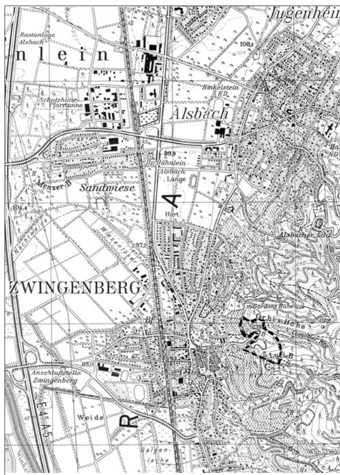
Abb. 2: Lage des Untersuchungsgebietes NSG „Orbshöhe von Auerbach und Zwingenberg“, aus der Topografischen Karte 1:25 000, Blatt 6217 Zwingenberg, mit Genehmigung des Hessischen Landesvermessungsamts unter der Nr. 2002-1-53 vervielfältigt.