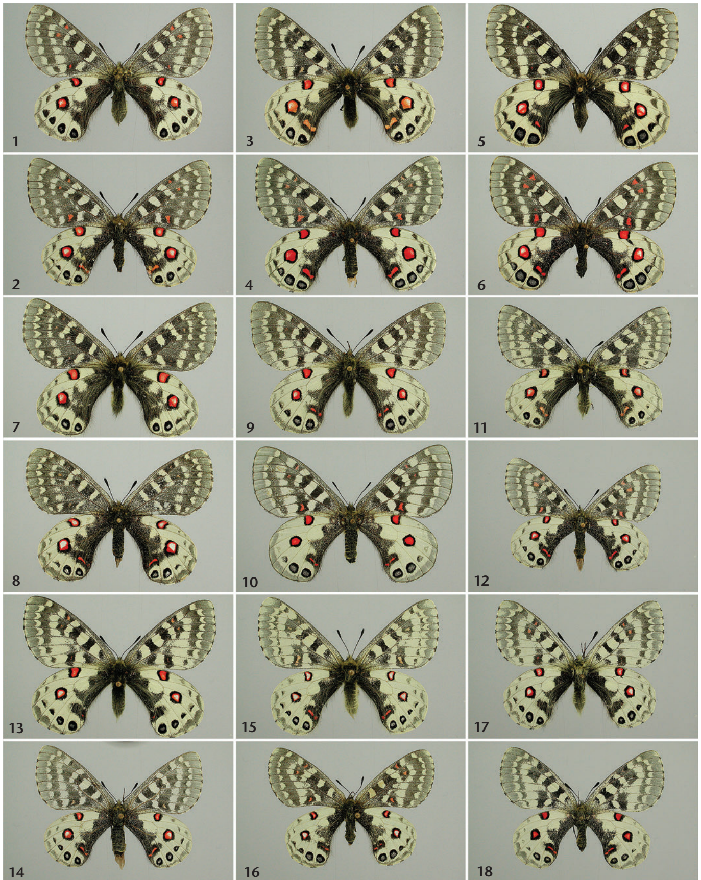
Abb. 1–36: Unterarten von Parnassius orleans OBERTHÜR, 1890. Abb. 1 (♂), 2 (♀): ssp. orleans , Kangting (Ta-tsien-lou), Chetou-shan, 2500–3500 m, vi. 1981. Abb. 3 (♂), 4 (♀): ssp. orleans (= ephebus ), NW-Yünnan, N. of Deqen, Baimaxue-Paß, 4600 m, 28. vi. 2000. Abb. 5 (♂), 6 (♀): ssp. orleans (= johanna ), C. China, Mt. Taibei Shan, Shaanxi prov., 3500 m, vi. 1998. Abb. 7 (♂), 8 (♀): ssp. mikamii , Sansu, 3900–4000 m, Kachin province, N. Myanmar, 3. viii. 1995. Abb. 9 (♂), 10 (♀): ssp. janseni . Abb. 9 (♂): China, Gansu, Gomba, 3500–3800 m, VII. 1988. Abb. 10 (♀): Prov. Gansu (Amdo), Hsi-ching Shan, 3000–3700 m, Labrang monastery (Xiahe), 25.–31. vii. 1986. Abb. 11 (♂), 12 (♀): ssp. haruspex , Südosttibet, Dongda La, 5000–5200 m, Nähe Markam, 29. vi.–3. vii. 1995. Abb. 13 (♂), 14 (♀): ssp. haruspex , China, Sichuan, Chola Shan, 4300–4900 m, Manigango, 11.–25. vi. 2002. Abb. 15 (♂), 16 (♀): ssp. haruspex (= lakshmi ), China, Tibet, Demu La, 4600–4800 m, 20. vi. 1997. Abb. 17 (♂), 18 (♀): ssp. haruspex (= chiehkuensis ), China, Qinghai, 60 km East of Zadoi, 4600–4900 m, 1.–11. vii. 1999. Abb. 19 (♂): ssp. haruspex , China, Sichuan, Batang, 4500 m, 3. vii. 1992.