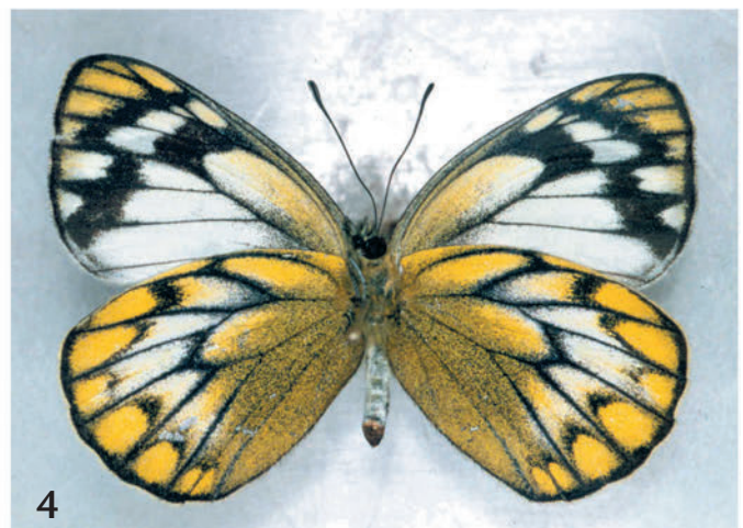
Abb. 1–4: Delias nuydaorum almae n. ssp. Abb. 1: Holotypus ♂, Oberseite. Abb. 2: Paratypus ♂, Unterseite. Abb. 3: Paratypus ♀, Oberseite. Abb. 4: Paratypus ♀, Unterseite. S. Mindanao, Mt. Parker. — Die Falter sind nicht ganz im gleichen Maßstab.