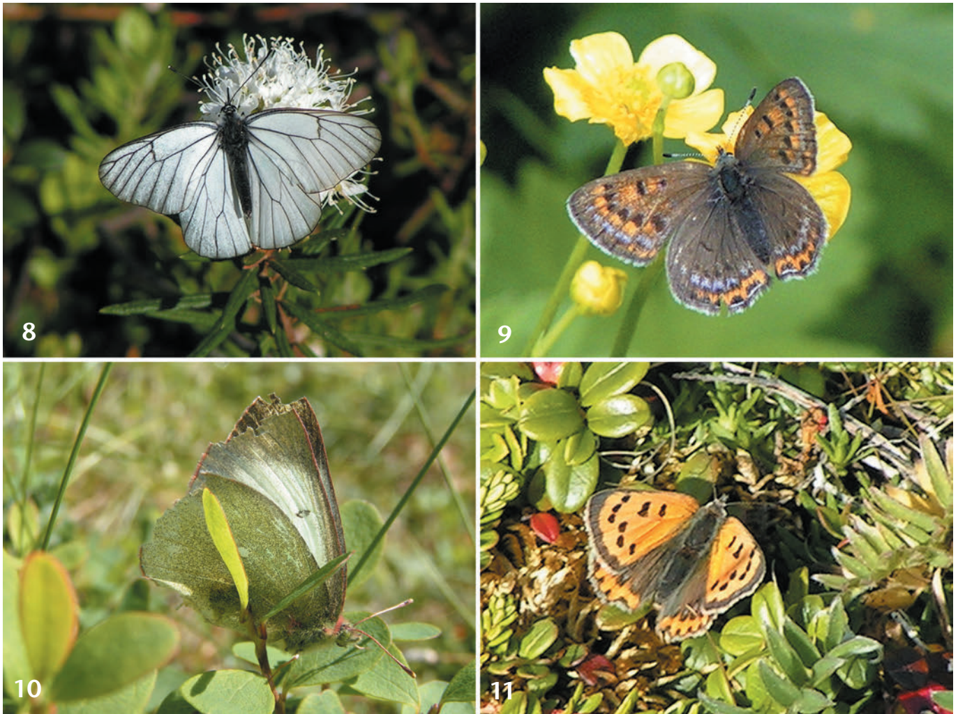
Tafel 2: Falter. Abb. 8: Aporia crataegi , an Sumpfporst saugend. Abb. 9: Lycaena helle auf einer bachbegleitenden vermoorten Trollblumenwiese. Abb. 10: Hochmoorgelbling ( Colias palaeno ) im ufernahen Bereich der Talflanke des Tana-Flusses. Abb. 11: Kleiner Feuerfalter ( Lycaena phlaeas ) auf einer Salzwiese am Varangerfjord.

nen vielfach in Menge beobachtet werden. Lokal kommt zu dieser Biozönose Argynnis aglaja (LINNAEUS, 1758) hinzu, dessen Raupe sich ebenfalls von Veilchen ernährt. Der an Rauschbeere und Blaubeere fressende Hochmoorbläuling ( Plebeius (Vacciniina) optilete (KNOCH, 1781)) ist gleichermaßen ein häufiger Blütenbesucher dieser Offenlandbiotope. Er fliegt zwischen den Gehölzgruppen suchend herum und steigt oft an Berghängen auf und ab. Waldumstandene Moore bevorzugt auch die Dickkopffalterart Carterocephalus palaemon (PALLAS, 1771). Ihre Imagines sind im Norden häufig im Bereich von Straßen und Gärten zu beobachten, die Raupen präferieren Süßgräser (Poaceae). Der Spanner Carsia sororiata (HÜBNER, 1813) muß als eine typische Art der Sauer-Arm- und Zwischenmoore (Begriffserklärung siehe SUCCOW & JOOSTEN 2001) betrachtet werden. Die Raupe frißt an Moosbeere und gehört regelmäßig zur beschriebenen Biozönose.