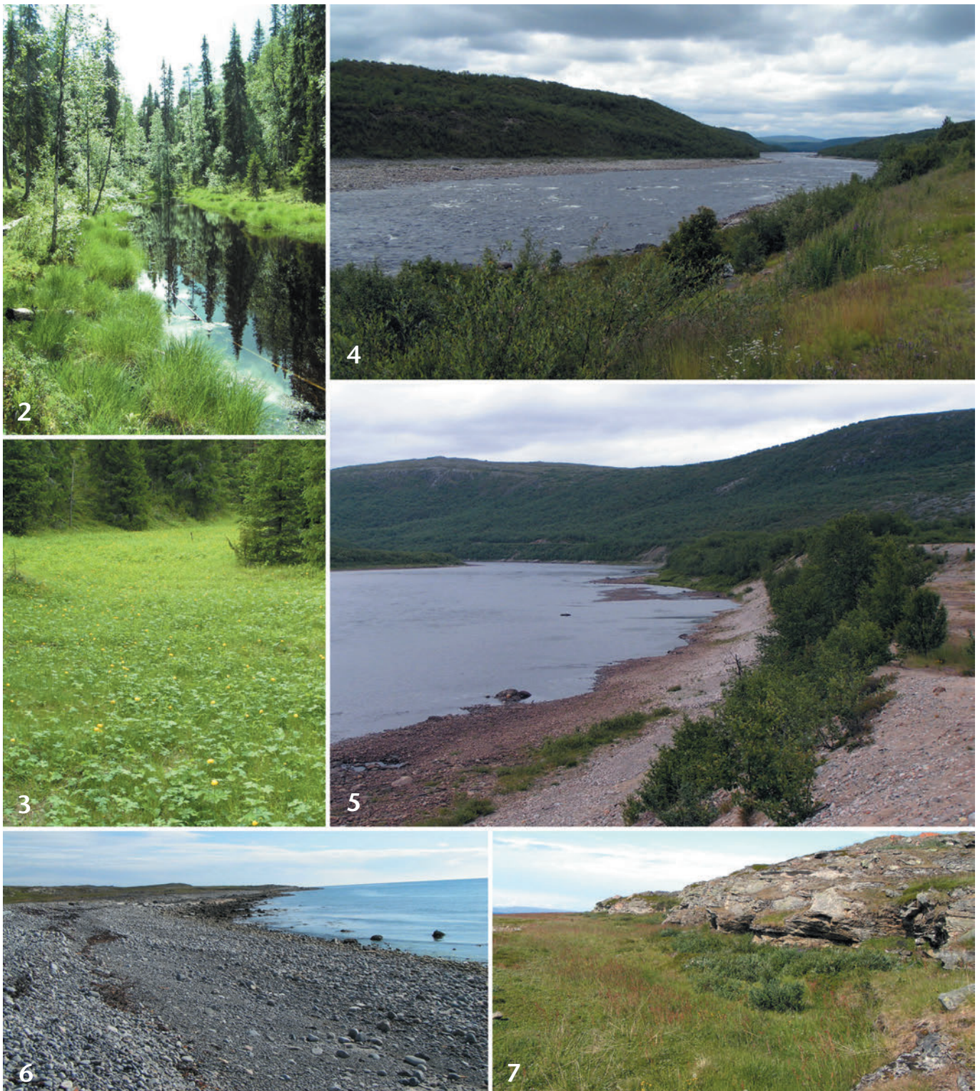
Tafel 1: Landschaftsformen. Abb. 2: Kleines, huminsäurebetontes Fließgewässer (Lagg-Abflüsse) mit ausgedehnten Randvermoorungen. Abb. 3: Ein kleiner Bach windet sich entlang des Waldes durch eine anmoorige Trollblumenwiese mit Vorkommen von Lycaena helle . Abb. 4: Ufer des Tana-Flusses mit Offenlandbereichen, auf denen Erebia medusa polaris vorkommt. Abb. 5: Durch starke Morphodynamik geprägter Bereich des Tana-Flusses mit Bankbildungen. Abb. 6: Steinküste im Bereich der Varangerhalbinsel bei Jakobselv. Abb. 7: Salzgrasland im Küstenbereich des Arktischen Ozeans.

den (vergleiche Abb. 2). Bei extensiver Wiesennutzung kommt es meist zum Blütenpflanzenreichtum und zur Steigerung der Nischenvielfalt (zum Beispiel Trollblumenwiesen, Abb. 3).