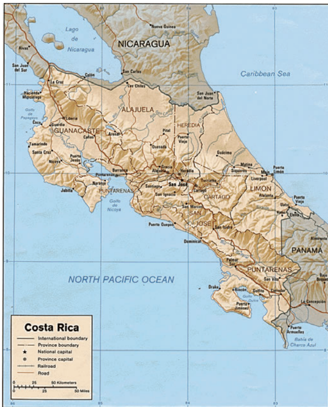
Abb. 1: Karte von Costa Rica.

ten Nord-Süd-Schneise (siehe Abb. 3) dann Dutzende von U. fulgens beobachtet werden. Die Tiere flogen in relativ dichter Folge in schnellem, geradlinigem und zielgerichtetem Flug ohne Zwischenstopps in Höhen zwischen ca. 1,5 und ca. 15 m in West-Ost-Richtung. Alle aus der Nähe beobachteten Tiere schienen relativ frisch geschlüpft und gut erhalten zu sein. Kurz nach 13.30 Uhr setzten Regenfälle ein. Ab diesem Zeitpunkt konnten zunächst keine weiteren wandernden Exemplare von U. fulgens gesichtet werden.