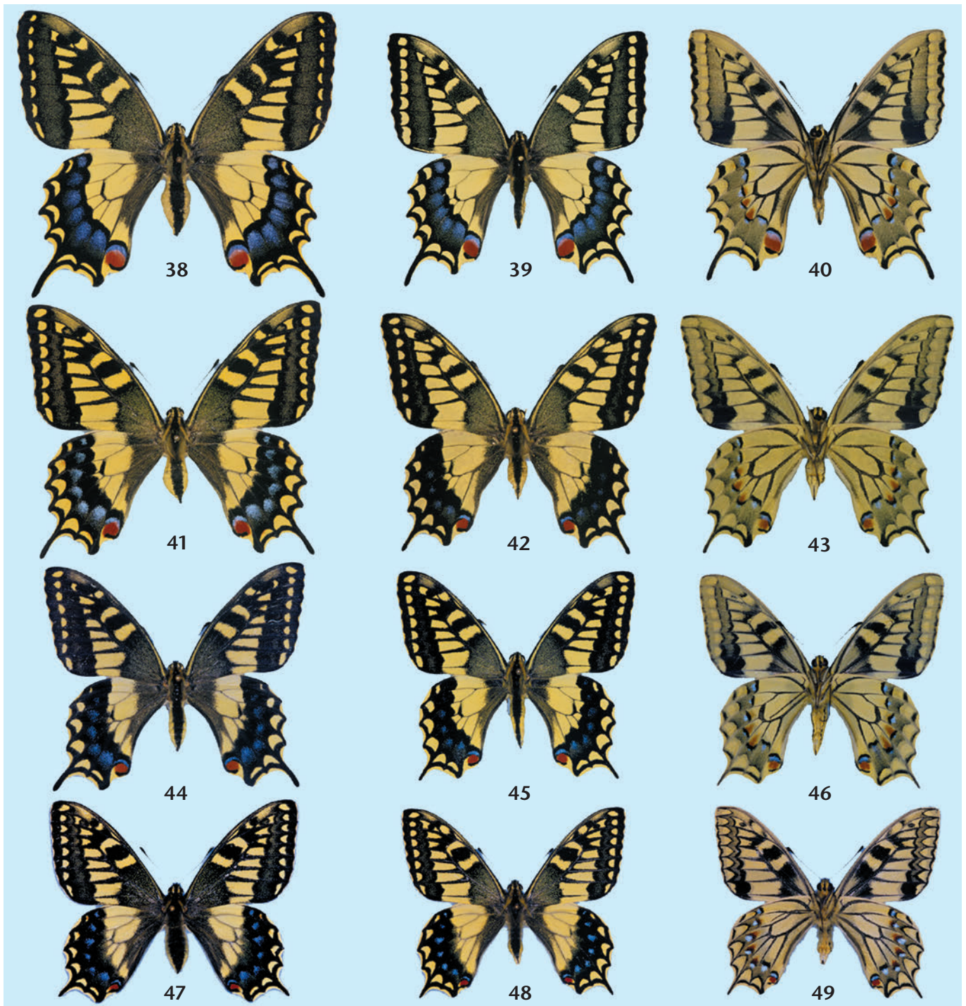
Abb. 1–14: Biologie des Hybriden A (= Papilio hospiton ♂ × P. machaon ♀). Abb. 1: Künstliche Paarung von P. hospiton ♂ × P. machaon ♀. Abb. 2: Eier an Fenchelblüten. Abb. 3: Frühes L 1 -Stadium an Fenchel. Abb. 4: Spätes L 1 -Stadium. Abb. 5: L 2 . Abb. 6: L 3 . Abb. 7, 8: L 4 . Abb. 9: L 5 eines vermutlichen Freilandhybriden von P. hospiton ♂ × P. machaon (Fund auf Sardinien an Fenchel). Abb. 10: Erwachsene L 5 . Abb. 11: Details eines mittleren Körpersegments (lateral) einer L 5 . Abb. 12: Zuchtpuppen des Hybriden A. Abb. 13: Zucht-♀ Hybrid A. Abb. 14: Zucht-♂ Hybrid A. — Abb. 15–27: Biologie des Hybriden B (= Papilio machaon ♂ × P. hospiton ♀). Abb. 15: Künstliche Paarung von P. machaon ♂ × P. hospiton ♀. Abb. 16: Eier 6 Tage nach der Eiablage an Ferula -Blüten. Abb. 17: L 1 . Abb. 18: L 2 . Abb. 19: L 3 . Abb. 20: L 4 . Abb. 21: L 5 (Dorsalansicht). Abb. 22: L 5 (Lateralansicht). Abb. 23: Details eines mittleren Körpersegments (lateral) einer L 5 . Abb. 24: Präpuppe. Abb. 25: Zuchtpuppen des Hybriden B. Abb. 26: Zucht-♀ Hybrid B. Abb. 27: Zucht-♂ Hybrid B. — Abb. 28–33: Praimaginalstadien des sardinischen Papilio hospiton . Abb. 28: L 5 (schwarze Morphe) lateral. Abb. 29: L 5 (schwarze Morphe) dorsal. Abb. 30: L 5 (grüne Morphe) lateral. Abb. 31: L 5 (gelbe Morphe) dorsal. Abb. 32: Zuchtpuppen von P. hospiton in beiden Farbvarianten. Abb. 33: Leere parasitierte hospiton -Puppe mit frisch geschlüpftem Parasitoiden ( Trogus lapidator ). — Abb. 34–37: Präimaginalstadien von Papilio machaon aus dem Gardaseegebiet. Abb. 34: L 5 (lateral) an Peucedanum . Abb. 35: L 5 (helle und dunkle Form) an Pimpinella . Abb. 36: Zuchtpuppen in beiden Farbvarianten. Abb. 37: Frisch geschlüpfter Hauptparasitoid von P. machaon aus Sizilien (nicht determiniert).

Abb. 38–40: Papilio machaon sphyrus , Imagines (1. Generation), ex Freilandraupe an Fenchel, Sizilien, Catania, Ätna, Ragalna, 750 m, leg. B. GIAN-DOLFO. Abb. 38: ♀, 20. v. 1984. Abb. 39: ♂, 29. iii. 1984. Abb. 40: ♂, Unterseite, gleiche Daten. — Abb. 41–43: Hybrid A ( P. hospiton ♂ × P. machaon ♀), Imagines aus der Zucht, auf Fenchel, cult. & in coll. NARDELLI. Abb. 41: ♀, 27. v. 1985. Abb. 42: ♂, 25. v. 1985. Abb. 43: ♂, Unterseite, gleiche Daten. — Abb. 44–46: Hybrid B ( P. machaon ♂ × P. hospiton ♀), Imagines aus der Zucht, auf Ferula , cult. & in coll. NARDELLI. Abb. 44: ♀, 4. vi. 1986. Abb. 45: ♂, 6. vi. 1986. Abb. 46: ♂, Unterseite, gleiche Daten. — Abb. 47–49: Papilio hospiton , Imagines, gezogen e.o. auf Ferula , Sardinien, Nuoro, Gennargentu-Berge, Aritzo Umg., 850 m, leg. F. HARTIG. Abb. 47: ♀, 29. iv. 1973. Abb. 48: ♂, 26. iv. 1973. Abb. 49: ♂, Unterseite, gleiche Daten.