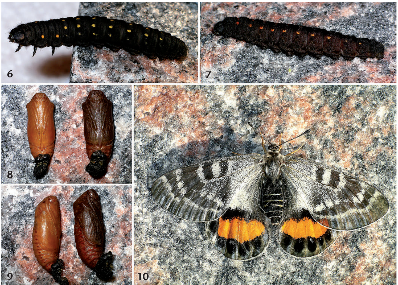
Farbtafeln: Parnassius autocrator . Abb. 1: Unbestimmte Nektarpflanze der Falter. Abb. 2: Corydalis fimbriifera , die Raupenfutterpflanze. Abb. 3: Habitat der Raupen. Abb. 4: Ei von P. autocrator . Abb. 5: Raupe von P. autocrator . Abb. 6: Raupe von P. autocrator mit zweiter Fleckenreihe. — Abb. 7: Zum Vergleich Raupe von P. charltonius . Abb. 8: Puppe von P. autocrator (links) und P. charltonius (rechts), Ventralansichten. Abb. 9: Puppe von P. autocrator (links) und P. charltonius (rechts), Lateralansichten. Abb. 10: ♀-Imago von P. autocrator . — Abb. 3: G. PAPE; übrige Fotos Autor.

Die Eier wurden bis November im Freien gelagert und dann bei Temperaturen knapp unter dem Gefrierpunkt überwintert. Zirka 50 % der Eier überlebten die Überwinterung.