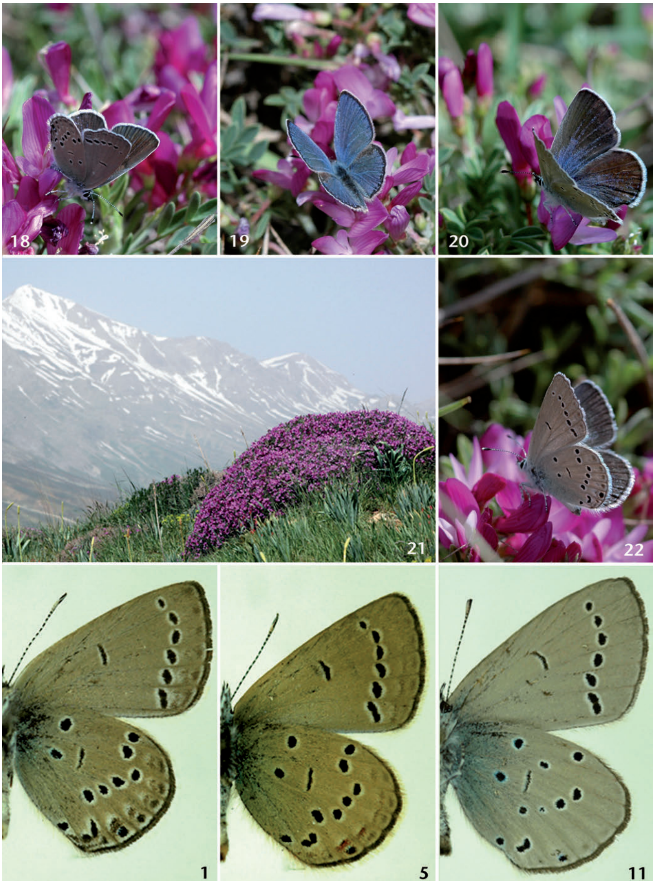
Farbtafel 2: Abb. 18–20, 22: C. staudingeri staudingeri , Mazanderan, zentraler Elburs, Polur–Firuzkuh, 2700 m, 25. v. 2007. Abb. 18, 20, 22: ♀. Abb. 19: ♂. Abb. 21: Biotop, Daten wie oben. — Abb. 1, 5, 11: Flügelunterseiten, ♂♂, vergrößert, Daten wie auf Farbtafel 1 unter gleicher Abbildungsnummer. Abb. 1: C. staudingeri staudingeri , HT. Abb. 5: C. staudingeri ardakanus ssp. n., HT. Abb. 11: C. staudingeri osirisimile ssp. n., PT.