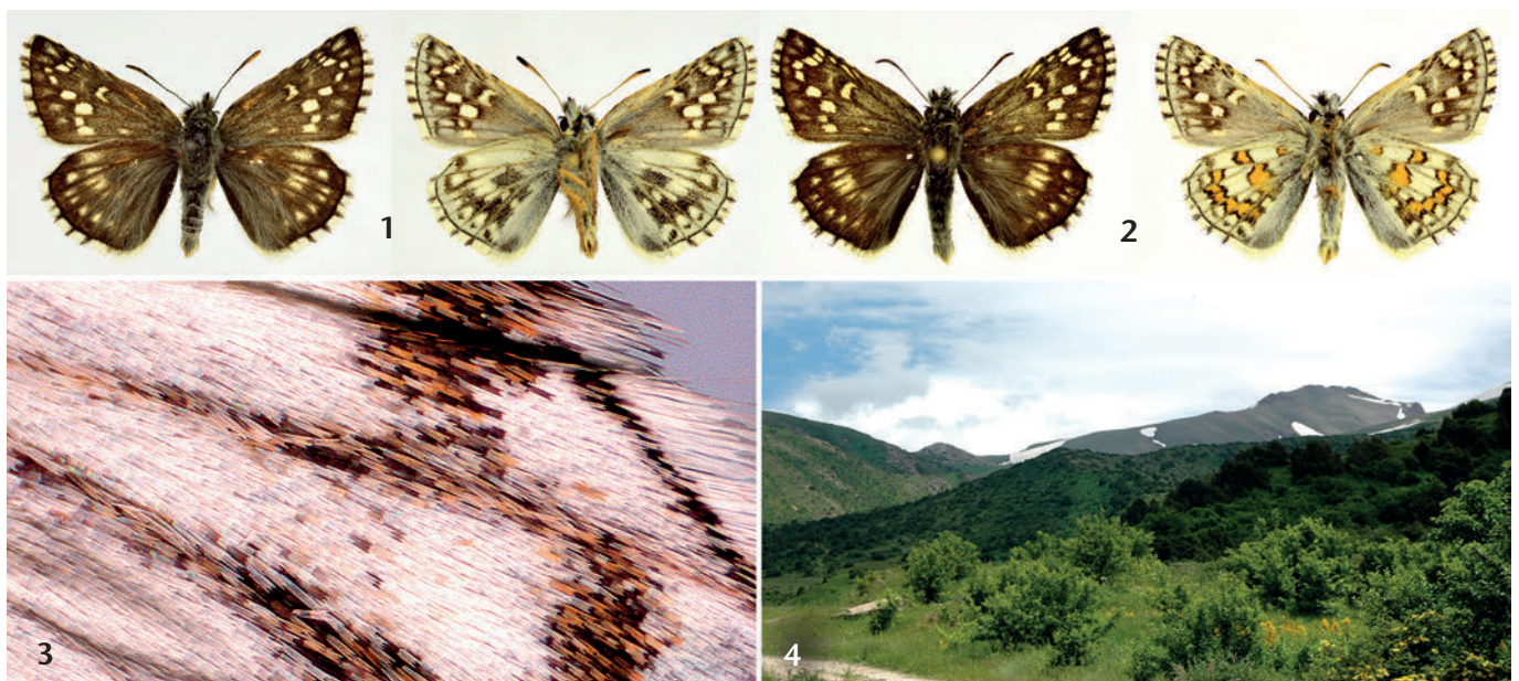
Abb. 1–2: Pyrgus sidae , ♂, SW-Kasachstan, NW Tien-Shan, Shimkent, Aksu-Zhabakly-Nationalpark, 1750 m, 11. vi. 2012, leg. et coll. W. TEN HAGEN. Abb. 1: aberrative Form. Abb. 2: normale Form. Abb. 3: Vergrößerter Ausschnitt der Hinterflügelunterseite des aberrativen P. sidae mit gelben Schuppen. Abb. 4: Besuchter kasachischer Biotop von P. sidae im Vordergrund.