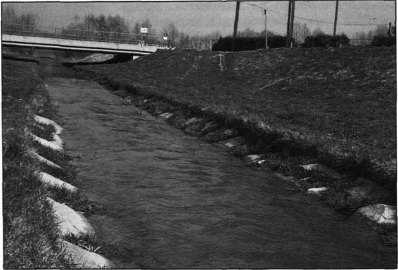
Abb. 3: Regulierter Wambach-Unterlauf mit typischem Trapezprofil und Uferwiesen.