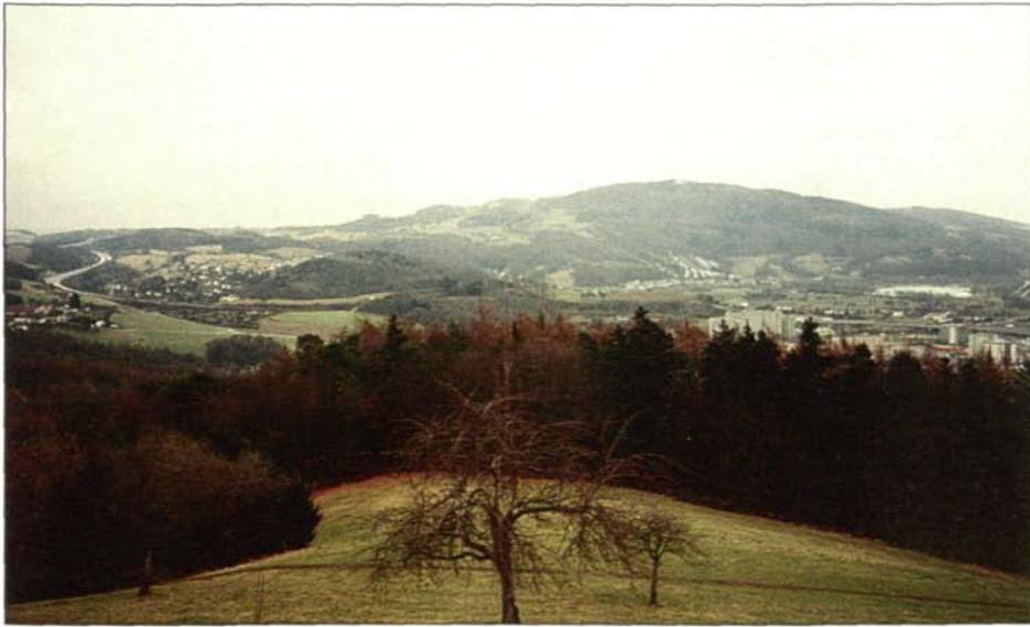
Abb. 3: Die vorgeschlagene Wildruhezone Pfenningberg liegt im Zentrum des Steyregger Waldes.

Steyregger Wald ist (schwerpunktmäßig im Sommer) ein beliebtes Linzer Ausflugs- und Wandergebiet. Aufgrund seines hohen Laubholzanteiles bietet dieser Wald außerhalb der Vegetationsperiode nur wenig Deckung, sodaß auch die in dieser Zeit geringeren Freizeitaktivitäten (Wandern, Mountainbiking) erhebliche Störungen sind. Eine ganzjährig störungsfreie Zone in diesem großen, relativ leicht zugänglichen Waldgebiet ist deshalb dringend erforderlich. Da der Pfenningberg die „Kernzone“ des Wildlebensraumes „Steyregger Wald“ ist, die für alle hier vertretenen Wildarten eine wichtige Funktion hat, wäre eine Wildruhezone am Pfenningberg sehr zweckmäßig (siehe Abb. 1 u. 3).