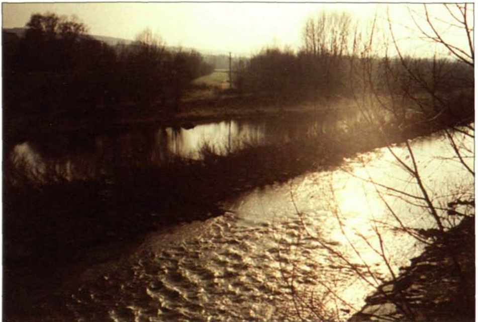
Abb. 5: Die schmalen Traunauen westlich von Ebelsberg brauchen dringend eine Wildruhezone.

Die Traunauen sind zwischen Traun und Ebelsberg Lebensraum für Rehwild, Hase, Fasan, Fuchs, Dachs, Marder, Graureiher, verschiedene Tag- und Nachtgreife und für mehrere Wasserwildarten. Die Wildlebensräume sind einem sehr hohen Siedlungsdruck und einer intensiven Belastung durch Freizeitaktivitäten (Wandern, Motocross, Fischen, Mountainbiking, Orientierungslauf, etc.) ausgesetzt. Auch hier ist daher die Einrichtung einer Wildruhezone dringend anzuraten. Der vorgeschlagene Bereich dieser Wildruhezone liegt in den Traunauen zwischen Audorf, Freindorf, dem Linzer Autobahnzubringer und St. Martin (siehe Abb. 1 u. 5).