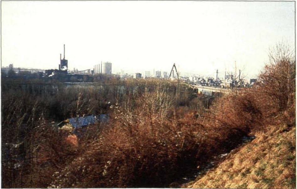
Abb. 4: Die vorgeschlagenen Wildruhezone Neuau liegt zwischen der B 3 bei Steyregg, einem Donau-Altarm am Westrand der Altau und der Donau.

lungsgebiet der Linzer und der Steyregger (Wandern, Radwandern, Mountainbiking, Jogging etc.). Am Donauufer verläuft der Donauradwanderweg. Die Neuau ist insbesondere aufgrund der Sperrwirkung des Altarmes der zwischen Altau und Neuau liegt, schwieriger erreichbar und daher weniger frequentiert als die benachbarten Auwaldbereiche, wodurch sie bereits jetzt ein Rückzugsgebiet der meisten hier vertretenen Wildarten ist. Eine Wildruhezone in der Neuau ist daher sinnvoll und sie sollte aufgrund des zunehmenden touristischen Druckes rasch eingerichtet werden (siehe Abb. 1 u. 4).