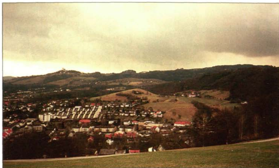
Abb. 2: Die vorgeschlagenen Wildruhezone Dießenleiten liegt im zersiedelten Gebiet des Bachlberges (Bildmitte).

Der Steyregger Wald bietet Rehwild, Hase, Fasan, verschiedenen Tag- und Nachtgreifen (u.a. Habicht, Waldkauz), Fuchs, Dachs, Marder und sporadisch dem Schwarzwild Einstand, Äsung und Deckung. Auch der