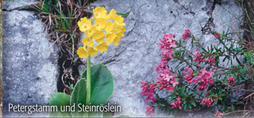
Petergamm und Steinröslein