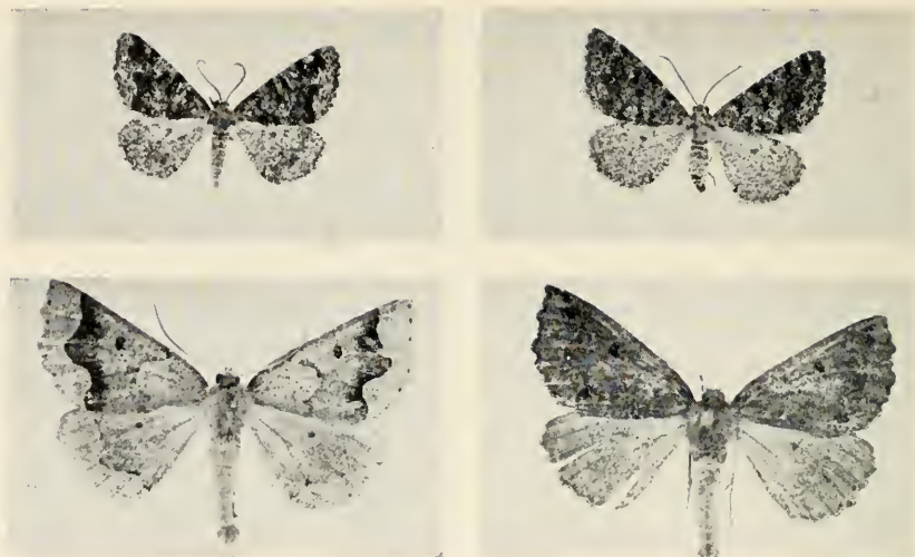
Abb. 1: Enconista tennoa Pinker ♂ Abb. 2: Enconista tennoa Pinker ♂ Abb. 3: Crocallis bacalladoi Pinker ♂ Abb. 4: Crocallis bacalladoi Pinker ♂

Gesamteindruck dunkelgrau bis schwarzbraun mit starker schwarzer Zeichnung, die durch die verschieden starke Ansammlung dunkler Punkte entsteht, wobei meist die Begrenzung des Mittelfeldes und der innerhalb des länglichen Discalstriches liegende Mittelschatten am stärksten ausgeprägt ist. Ein Außenband, meist im ersten Drittel nach innen ausgekerbt, schließt sich an das Mittelfeld. Am Hinterflügel ist dieses Außenband nur angedeutet, der Discalpunkt aber klobig. Auch die Unterseite mit durchscheinendem dunklen Außenbande und Discalfleck geziert. Die Hinterflügelunterseite schmutzig weißlich, heller als jene der Vorderflügel. Von exustaria Stgr. (21—30 mm) durch die Größe sowie andere und verschwommene Zeichnung zu unterscheiden. Die Fühlerkämme schwächer als bei minosaria Dup. entwickelt, die Fühler kürzer. Das ♀ etwas weniger kontrastreich als das ♂ gezeichnet, düsterer gefärbt, mit fadenförmigen Fühlern.