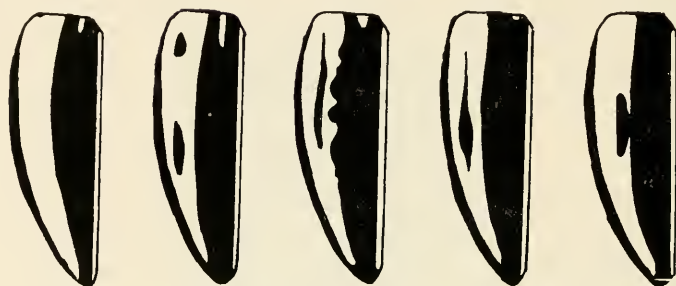
Abb. 8 D. halepense KR. ♂♂.

Anat. mer. Umg. Sakçagözü w. Gaziantep, 900 m, IV. 73 w. Kilis, 350 m, IV. 76