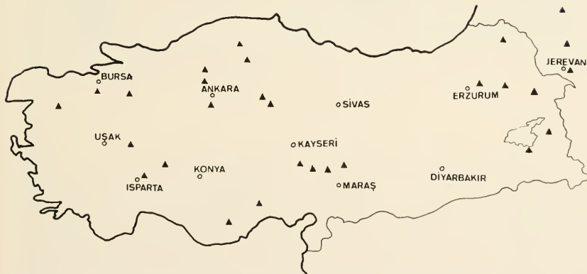
Abb. 3 Die anatolischen Populationen des D. scabricolle DALM. nach Sammlungsbelegen des Verfassers.