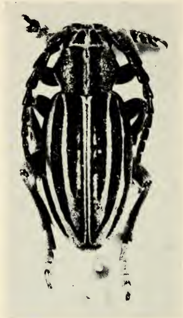
Abb. 6 D. sinopense BREUN. ♂.

Da es sich hierbei um ein Einzelstück handelt und die Art pseudoholosericeum (nach einem ♀ beschrieben) weitgehend unbekannt ist, muß die Zuordnung des Heinzschen Belegstückes als unsicher angesehen werden.