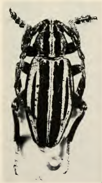
Abb. 7 D. schultzei HEYD. ♂.