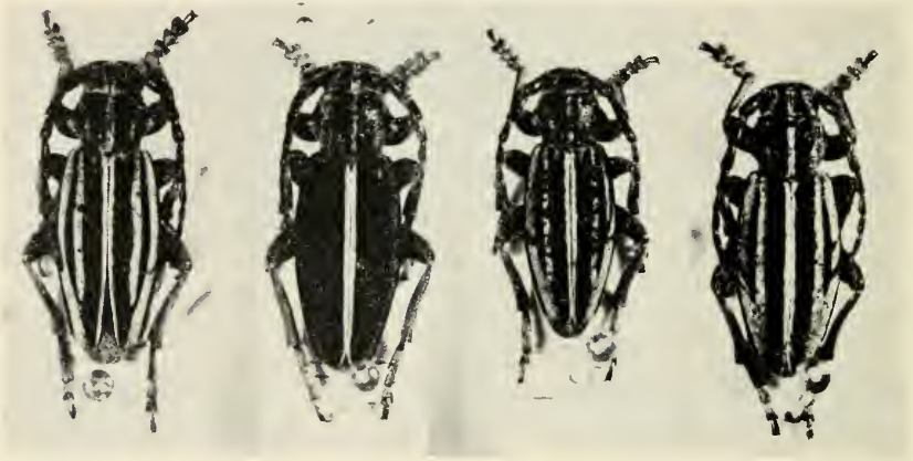
Abb. 4 D. iconiense DAN. Variationsbreite der ♂♂.

Unter der Population des D. iconiense von Yazılıkaya findet sich eine Reihe in der Zeichnung stark abweichender Tiere: Die Decken fast kahl, z. T. glänzend, mit deutlich ausgebildeter Suturalbinde, die beiderseits von einer samtschwarzen, schmalen Binde eingefasst ist. Mit Ausnahme der Deckenseiten fehlt das Grundtoment und die Humeral- bzw. Dorsalbinde ist im allgemeinen nur apikal angedeutet. Diese Tiere sind dem von Breuning (1966) nach einem Einzelbeleg aus Boğazkale beschriebenen D. subatritarse sehr ähnlich. Durch das freundliche Entgegenkommen von Herrn Perissinotto konnte der Verfasser den Typus des subatritarse untersuchen. Er gehört mit großer Wahrscheinlichkeit zu der von Heinz nachgewiesenen Form. Die Art subatritarse ist deshalb nach der Meinung des Verfassers als synonym zu iconiense zu betrachten ( syn. nov. ). Die oben charakterisierte Form zeigt bei einigen Tieren so eindeutige Übergänge zu iconiense , daß an der Artgleichheit kein Zweifel bestehen kann. Ähnliche Formen mit stark reduzierter oder völlig fehlender Bindenzeichnung finden sich auch unter den Populationen des iconiense aus Mucur.