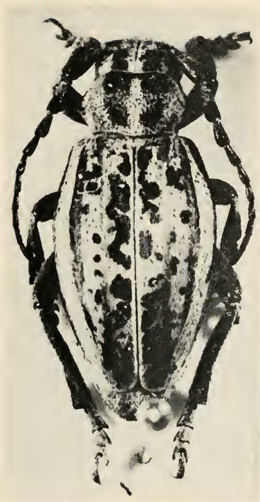
Abb. 1 D. infernale MULS. & REY. Extrem aberrative ♀-Form

auch unter anderen infernale -Populationen vor. H e i n z hat das Gebiet um Bakırdağı, Yalakköy und Göksun intensiv besammelt, konnte jedoch nur infernale nachweisen, die keinerlei Hinweis darauf geben, daß es sich hierbei um eine andere Art handeln könnte. Bemerkenswert ist die Tatsache, daß sich unter den infernale -Belegen von Bakırdağı ausschließlich tomentierte ♀♀ der Form m. murinum Breun. finden, während an anderen, westlicher gelegenen Fundorten des infernale stets untomentierte ♀♀ der Nominatform gegenüber tomentierten weiblichen Formen zahlenmäßig überwiegen. Da sich jedoch weder die männliche noch die weibliche Form der Belege von Bakırdağı von bekannten Formen des infernale wesentlich unterscheiden, dürfte miminfernale als artgleich mit infernale anzusehen sein ( syn. nov. ).