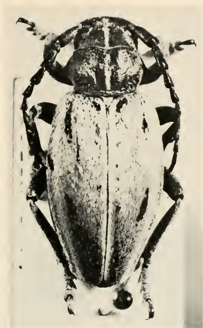
Abb. 2 D. scabricolle DALM. — Extrem aberrative ♀-Form.