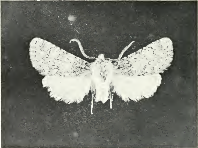
Abb. 1: Dasypolia shugnana sp. n. Holotypus

Fühler beiderseits gekämmt, Kammzähne sind mehr als 1,5mal so lang wie