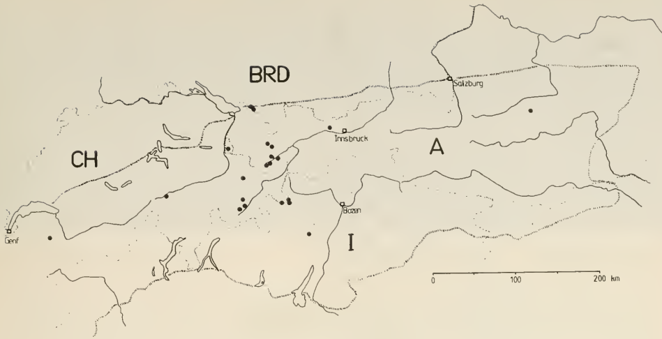
Abb. 1: Fundorte (●) von S. claviventris in den Alpen; zur Orientierung sind das Flußsystem, die Grenzen der Alpenländer und die Abgrenzung des Alpenraumes eingezeichnet (nach Daten von AUBERT et al. 1976: 131, BRUGGE briefl. (coll. Instituut voor Taxonomische Zoölogie, Amsterdam) CLAUSSEN 1987: 342, LINDNER & MANNHEIMS 1956: 124, LUCAS briefl. (coll. LUCAS, Rotterdam), OLDENBERG 1916: 104–5, ROHLFIEN & EWALD 1975: 157, SZILÁDY 1938: 140–1; STROBL 1910: 104–5).

25.6.–27.8. mit Maximum Mitte Juli an ( n = 24 ), GOELDIN (1974: 160) fand die Art ebenfalls in der Westschweiz zwischen dem 16.5. und dem 15.7. Das Typus-Exemplar fing STROBL (1910: 104–5) Ende Mai in der Steiermark. Die Höhenverbreitung weist S. claviventris als echtes Gebirgstier aus, das zwischen 980 m und 2700 m über NN angetroffen werden kann. Bevorzugt wird die subalpine und alpine Höhenstufe zwischen 1800 m und 2400 m. Hier ist die Art besonders an feuchten Stellen in Wiesen-, Rasen- und Hochstaudengesellschaften zu finden (s. o., CLAUSSEN l. c.).