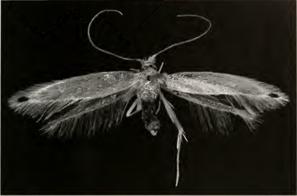
Abb. 1. Bucculatrix apicipunctella sp.n., Paratypus.