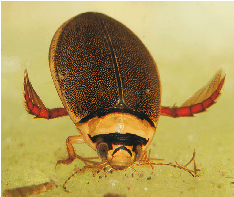
Abb. 2: Graphoderus bilineatus (DE GEER, 1774), Imago.

In einigen Gewässern (Moorkolk 2 bei Iffeldorf, Filzbuchweiher, Stechsee) waren dagegen nur äußerst arten- und individuenarme Wasserkäfergemeinschaften festzustellen. Ein erhöhter Prädationsdruck durch verschiedene Fischarten (z.T. künstlicher Besatz) auf die Larvalstadien vieler Wasserkäferarten ist hier sicherlich für die geringe Arten- und Individuenzahl verantwortlich zu machen.