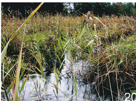
Abb.: 15, 16 & 17: Kleines Nebengewässer des Frechensees, Lebensraum des FFH-Schwimmkäfers Graphoderus bilineatus ; 18: Großes Nebengewässer des Frechensees, Lebensraum des in Bayern vom Aussterben bedrohten Schwarzen Kolbenwasserkäfers Hydrophilus aterrimus ; 19: Filzbuchweiher; 20: Südufer des Stechsees ( F13 ).