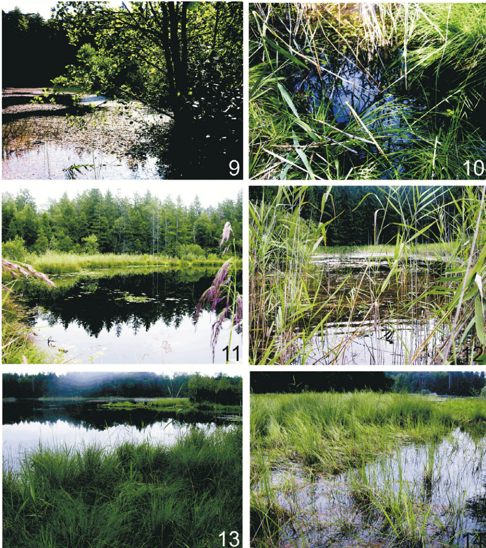
Abb. 9 & 10: Schwarzweiher südlich Allmannshausen, Lebensraum des FFH-Schwimmkäfers Graphoderus bilineatus und des in Bayern bisher als verschollen eingestuftes Graphoderus austriacus . Überblick über den Weiher und Reusenstandort im Röhrichtgürtel; 11: Filzweiher westlich Tutzing; 12: Kerschbacher Filz; 13: Nordwestufer des Frechensees; 14: Bucht am Nordwestufer des Frechensees, Lebensraum von Graphoderus bilineatus .

allen Teilen Deutschlands stark zugenommen. Waren vor wenigen Jahren nur eine Handvoll Belege aus Oberbayern bekannt, so ist die Art heute neben dem Gemeinen Gelbrandkäfer Dytiscus marginalis häufig die einzige Grobschwimmkäferart, die selbst von Wald umgebene permanente Moorgewässer erfolgreich besiedelt (Moorweiher 2 bei Iffeldorf, Bernrieder Filz, Frechensee). Cybister lateralimarginalis besiedelt perennierende, stehende und vegetationsreiche (emerse und submerser Pflanzen) Gewässer, wie lineare Standgewässer, Weiher, Teiche, Flach- und Mooreseen. Der Untergrund – ob Moor-, Sand- oder Lehmboden – spielt keine entscheidende Rolle bei der Habitatwahl. Exponierte Gewässer, die zudem über eine ausgedehnte, struktur- und makrophytenreiche Flachwasserzone verfügen, werden bevorzugt besiedelt.