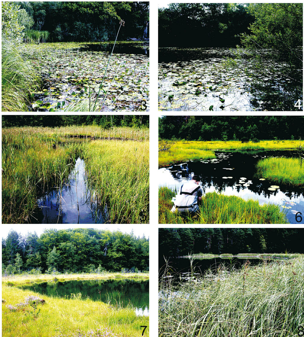
Abb. 3 & 4: Neuweiher am Kirchsee, Lebensraum des Gauklers und der in Bayern stark gefährdeten Wasserwanze Notonecta lutea ; 5: Kirchseemoor; 6: Moorweiher 1 bei Iffeldorf, Lebensraum des in Bayern als verschollen geführten Graphoderus austriacus und des stark gefährdeten G. zonatus ; 7: Moorweiher 2 bei Iffeldorf; 8: südliches Fohnseebecken, Lebensraum des stark gefährdeten Schwimmkäfers Laccophilus poecilus .

Der Gaukler galt lange Zeit als sehr seltene und vom Aussterben bedrohte Art, auch in Bayern (HEBAUER et al. 2004). In den letzten zehn bis zwanzig Jahren haben die Bestände jedoch in fast