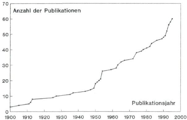
Abb. 2.: Entwicklung der wissenschaftlichen Publikationen über Wassermollusken im Bundesland Salzburg