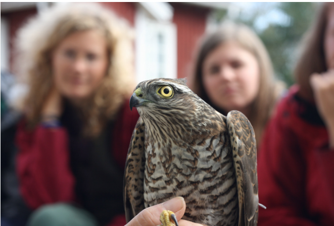
Abb. 3: Ein gerade gefangener Sperber kurz nach seiner Beringung.