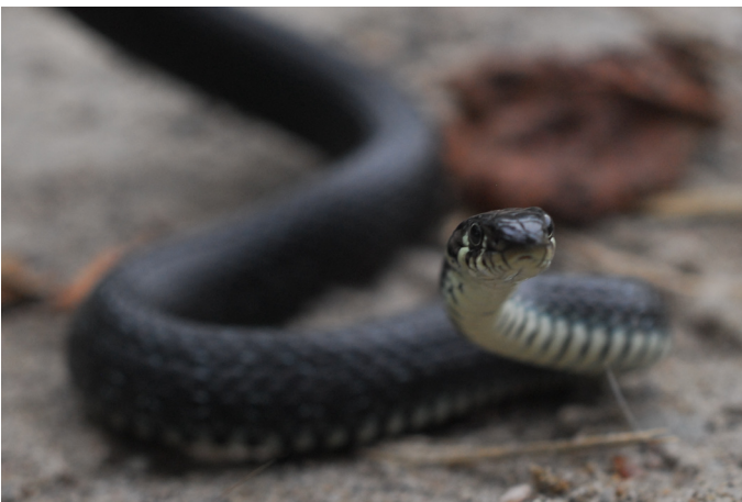
Abb. 4: Ringelnatter am See Yggidesjön. Gut erkennbar ist der Melanismus dieses Exemplars, also die weitestgehende Schwarzfärbung, die einer besseren Ausnutzung des Sonnenlichtes dient, was typisch für nördliche Regionen ist.