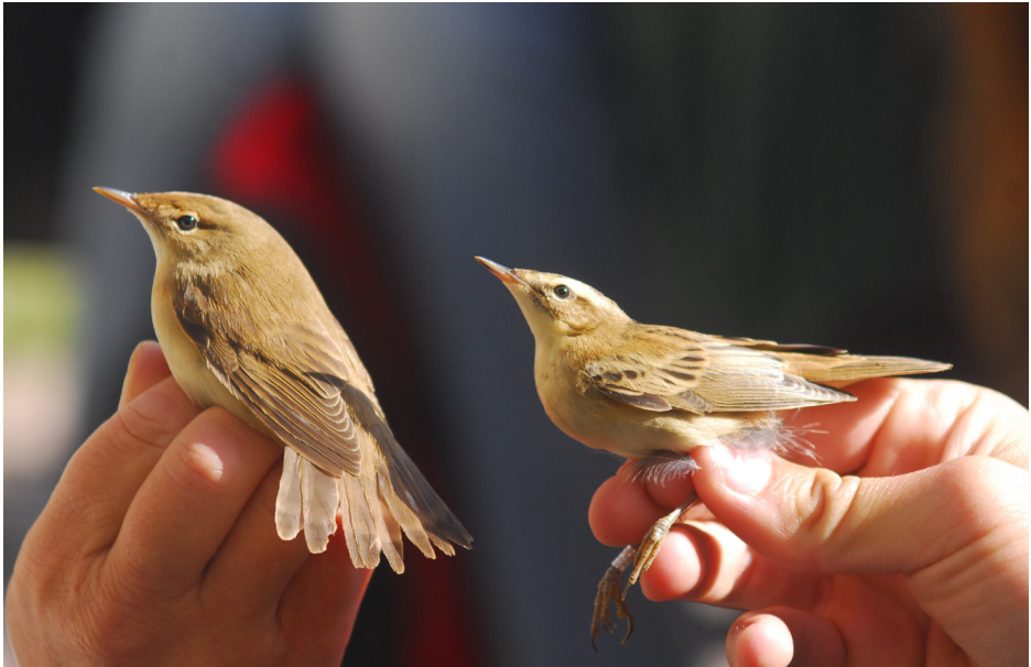
Abb 5.: Teichrohrsänger (links) und Schilfrohrsänger (rechts) im direkten Vergleich nach der Beringung.

den Weg setzt und sich prima durchs Fernglas betrachten lässt, sowie einem Baumfalken der für uns eine extra Runde über dem Feld dreht, sodass alle von uns die längsgestreifte Unterseite und die „roten Hosen“ deutlich sehen können. Am Feldrand sitzt zudem noch ein Rebhuhn. Natürlich wird auf unseren Fahrten kein offen stehender Apfel- oder Birnenbaum ausgespart und auch die Brombeer- und Himbeerhecken sehen nach uns anders aus als vorher.