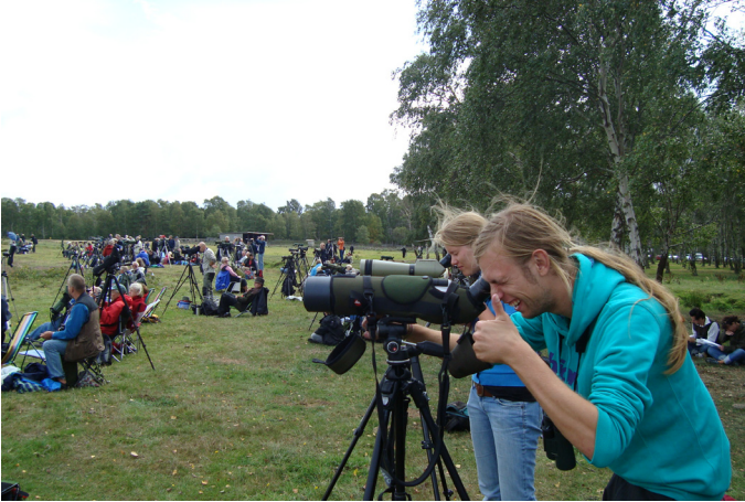
Abb. 2: Massenbeobachtungsereignis „Honey Buzzard Day“ - und der DJN ist mittendrin. Auf der Wiese befindet sich nach unserer Schätzung Fernoptik im Gesamtwert von über einer halben Million Euro.